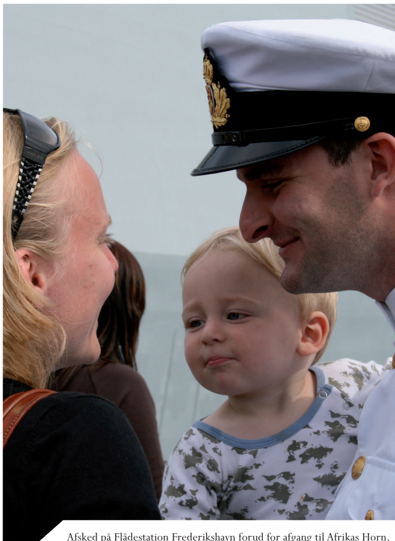
Afsked på Flådestation Frederikshavn forud for afgang til Afrikas Horn.