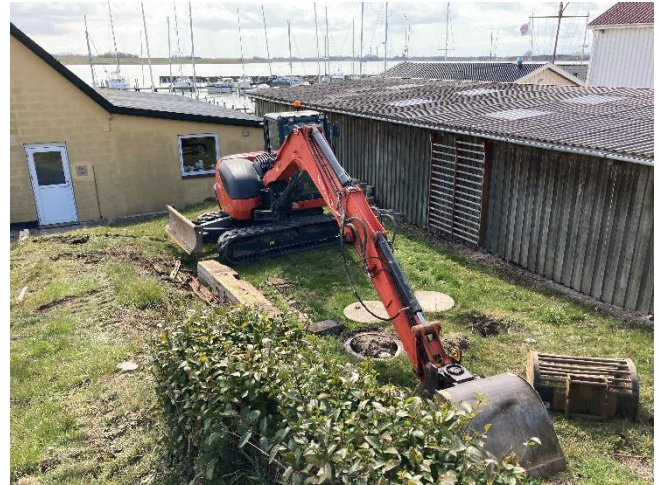
Entreprenørs gravemaskine på plads.