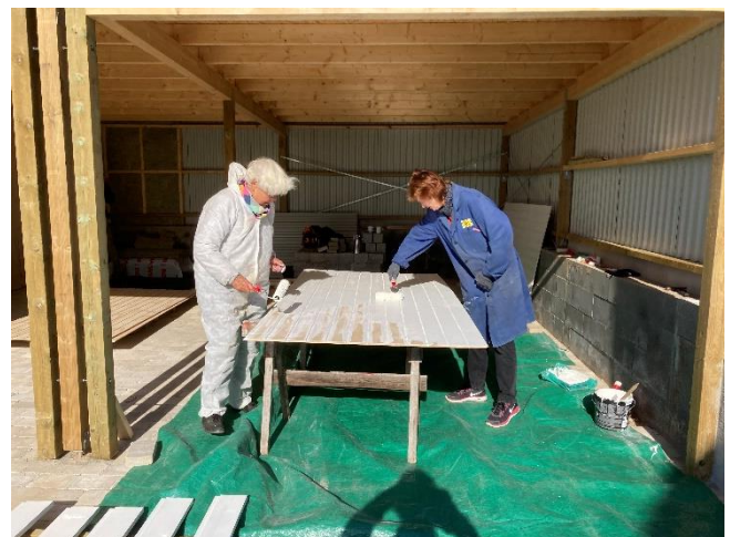
Plader til udhæng males.