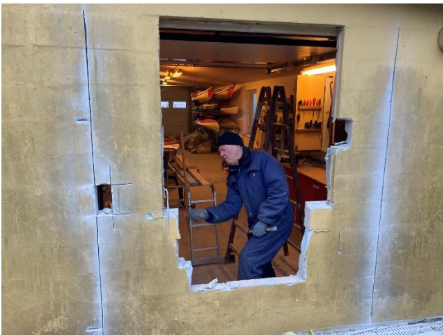
Muren brydes ned.