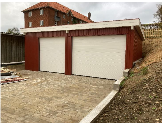
Den færdige bygning.