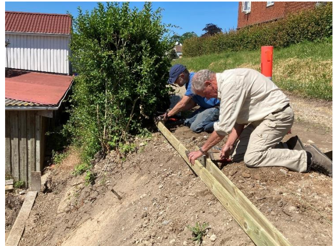
Der arbejdes med hegn mod vej.