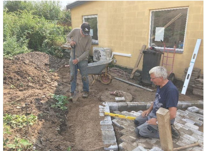
Start på trappe.