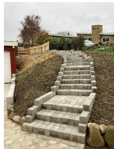
Den færdige trappe