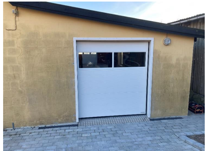
Den færdige port.