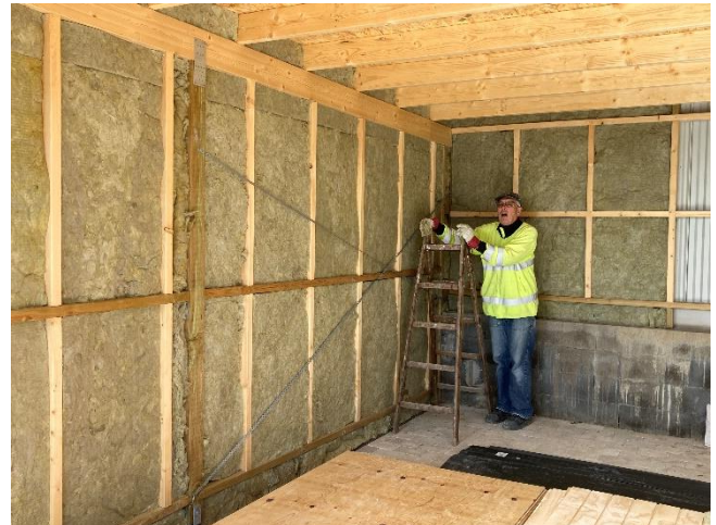
Brandvægge mod skel er isoleret.