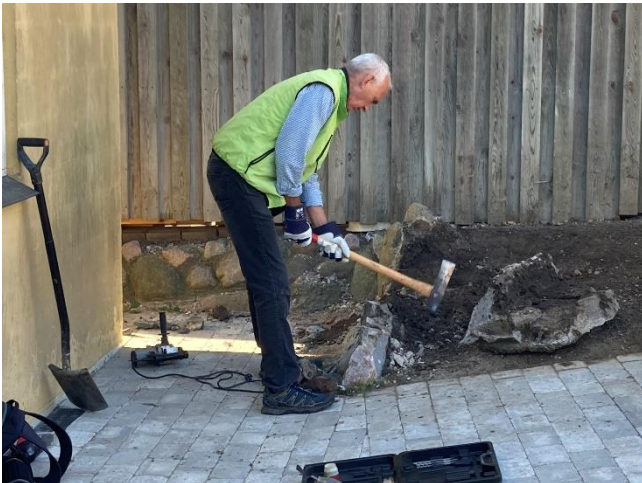
Stengærde fjernes ...