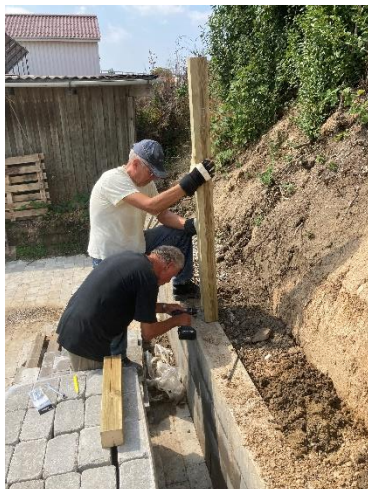
1. stolpe til bygning sættes.