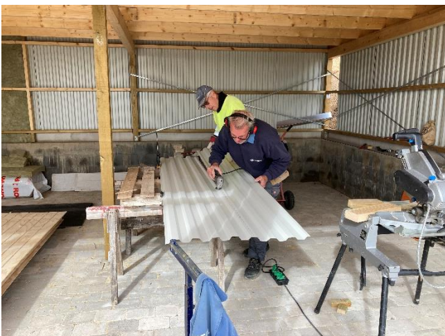
Trapezplade til væg skæres til.