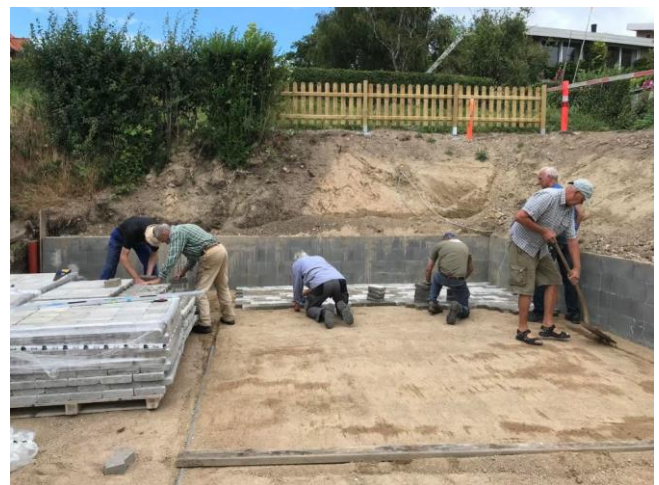
Der lægges fliser.