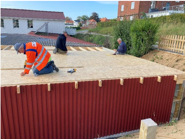
Vægge er delvist beklædt. Der lægges tagplader.