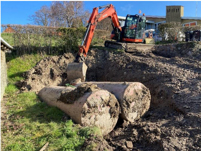
Olietanke gravet fri.