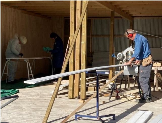
Malearbejde og tilskæring af sternbræt.