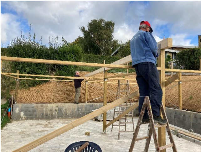
1. rem lægges op.