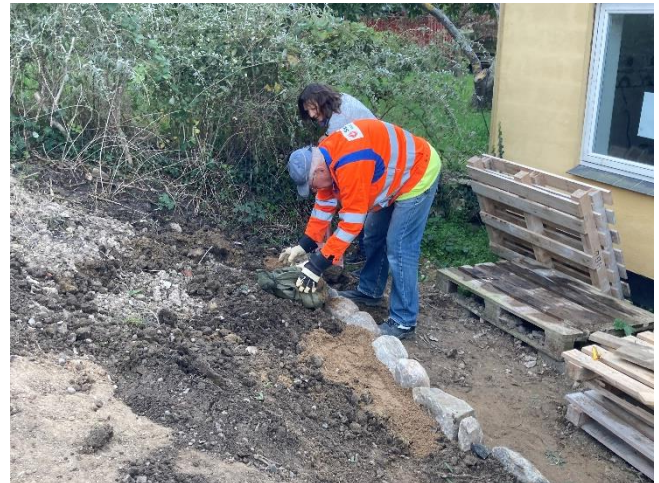
... og bygges.