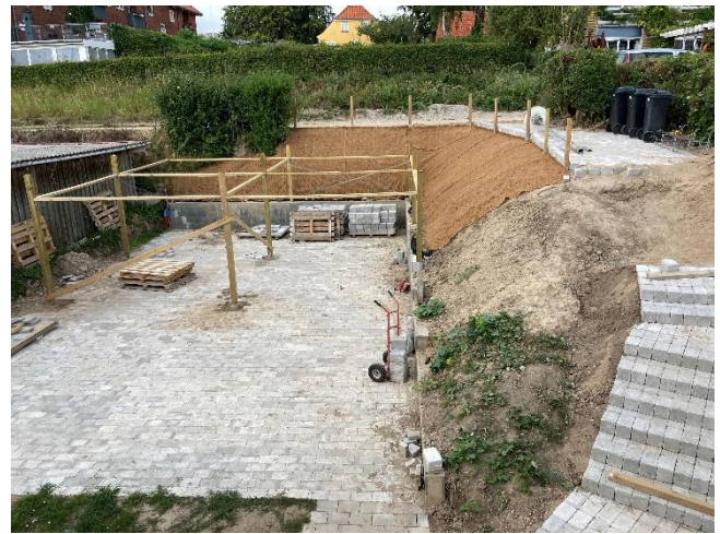
Stolper er sat. Der er lagt dug på skråninger, og lagt fliser ved skraldespande.