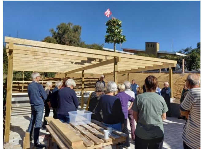
Rejsegilde i flot solskin.