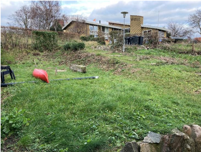
Grunden før byggeriet.