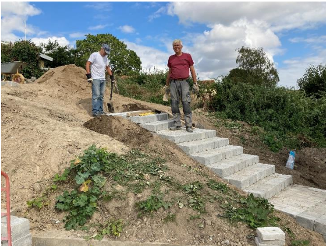
Trappen på vej.