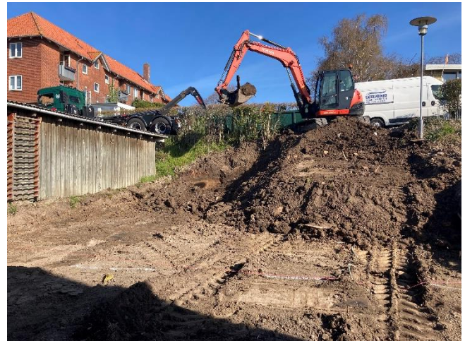
Gravearbejde i gang.