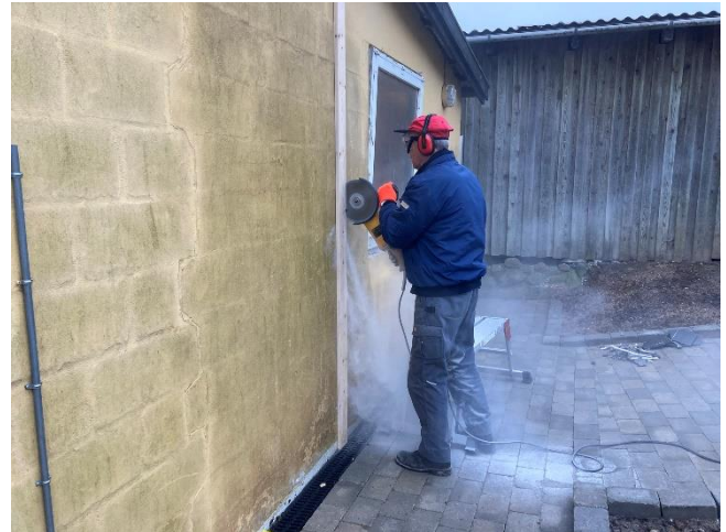
Der skæres hul til port i hus.