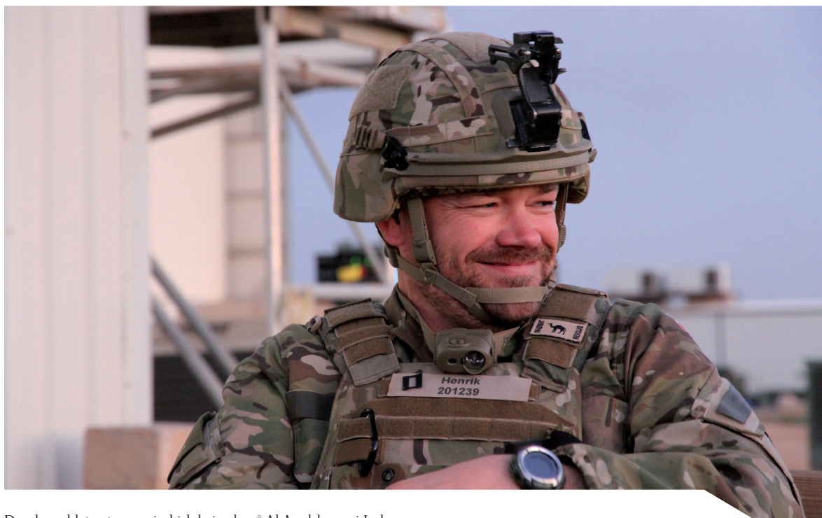
Danske soldater træner irakisk brigade på Al Asad-basen i Irak.