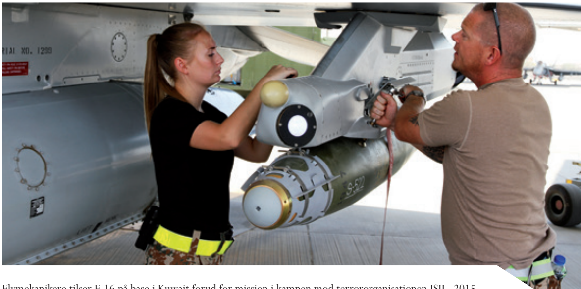
Flymekanikere tilser F-16 på base i Kuwait forud for mission i kampen mod terrororganisationen ISIL, 2015.

Selv den bedste forberedelse vil aldrig kunne være en garanti mod følger af svære belastninger. Der skal derfor være mulighed for at modtage kompetent psykologstøtte ved voldsomme hændelser i missionsområdet. Ligeledes skal chefer og ledere være uddannet til at agere ved belastende hændelser, og de udsendte skal trænes i kammeratstøtte og stresshåndtering.