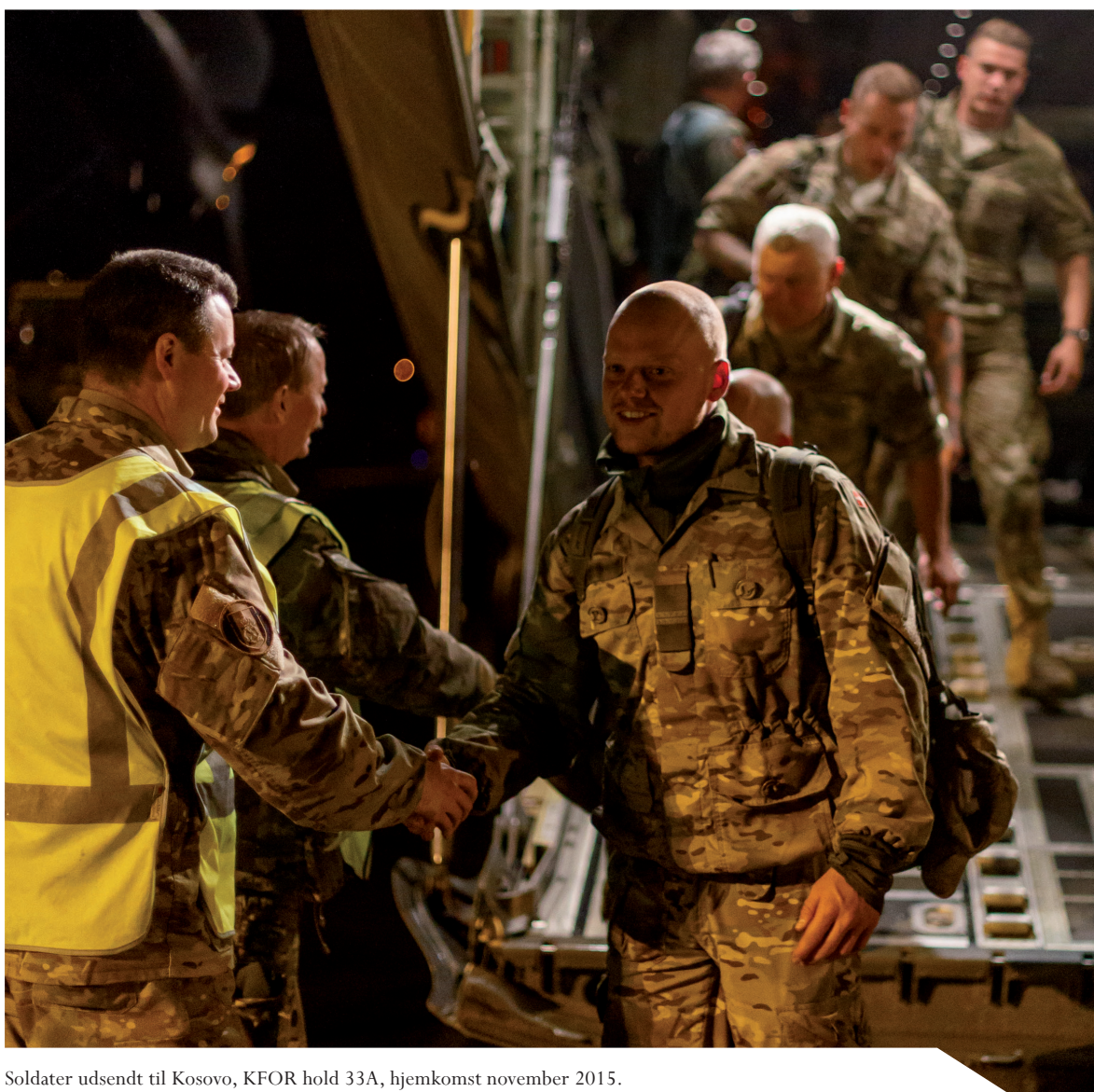
Soldater udsendt til Kosovo, KFOR hold 33A, hjemkomst november 2015.

Veteranpolitikken gælder for veteraner, der har været udsendt i regi af Forsvarsministeriet