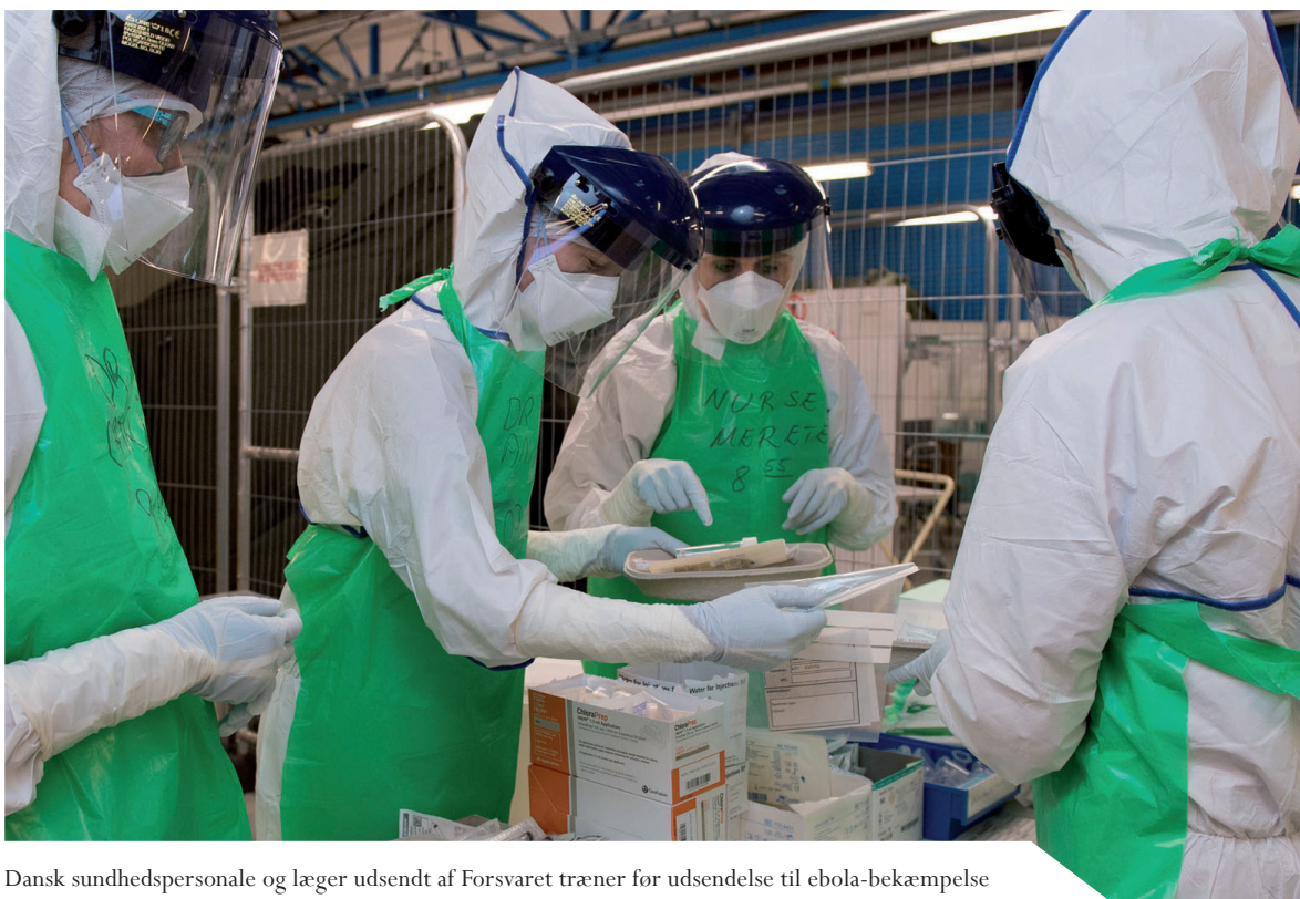
Dansk sundhedspersonale og læger udsendt af Forsvaret træner for udsendelse til ebola-bekæmpelse i Sierra Leone 2015.