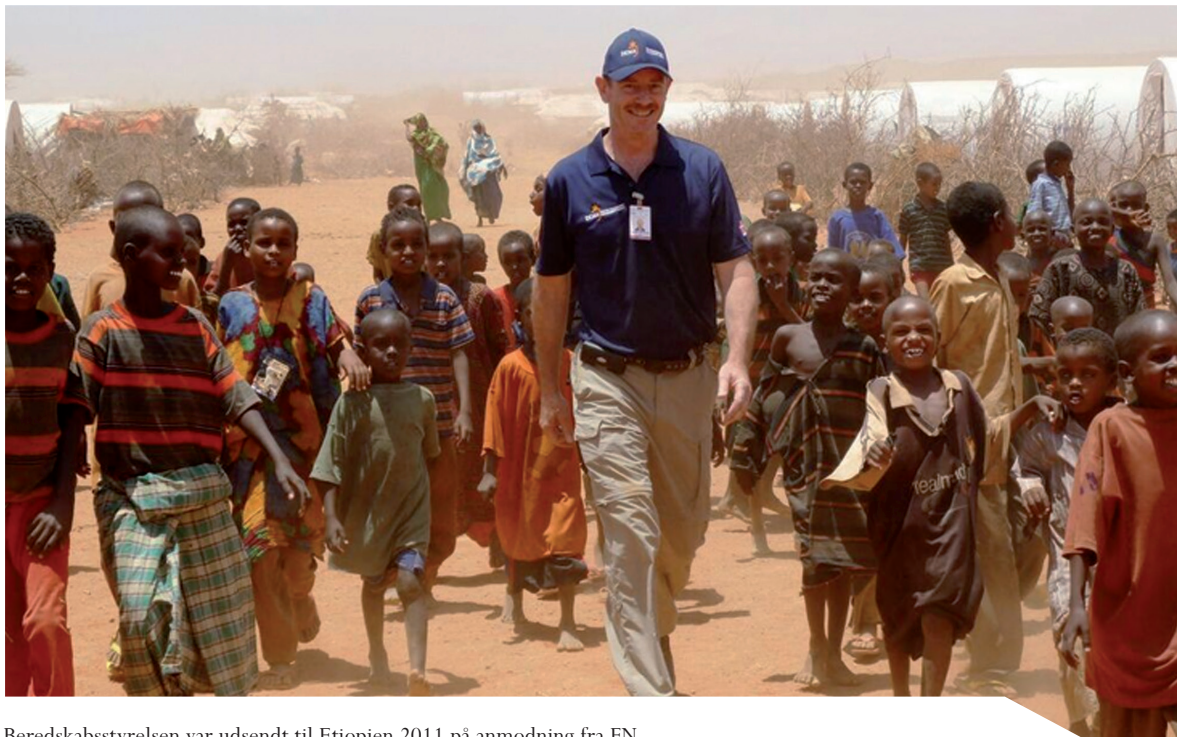
Beredskabsstyrelsen var udsendt til Etiopien 2011 på anmodning fra FN.

Tjeneste i internationale missioner udføres på vegne af Danmark. Når veteraner vender hjem, er det et fælles ansvar at give dem en respektfuld modtagelse