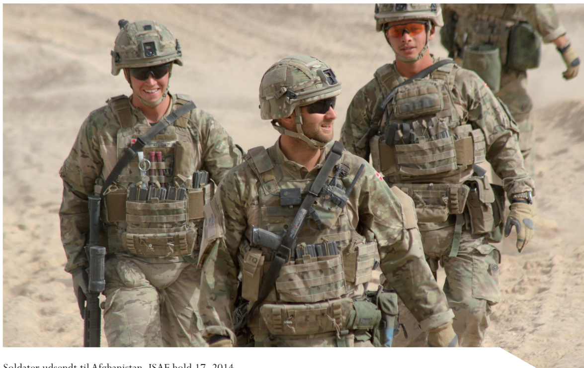
Soldater udsendt til Afghanistan, ISAF hold 17, 2014.

Veteraner, som under deres udsendelse har været udsat for traumatiserende oplevelser og fx oplever problemer med at tilpasse sig hverdagen, kan få bistand fra psykologer og andre faggrupper. Tilbuddet er tidsbegrænset og gælder tillige for veteraners pårørende – før, under og efter udsendelsen.