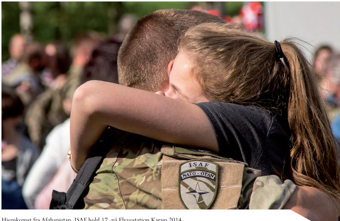
Hjemkomst fra Afghanistan, ISAF hold 17, på Flyvestation Karup 2014.

Veteranerne er ikke ene om at blive påvirket af en udsendelse, det bliver baglandet også. De pårørende er en integreret del af indsatsen