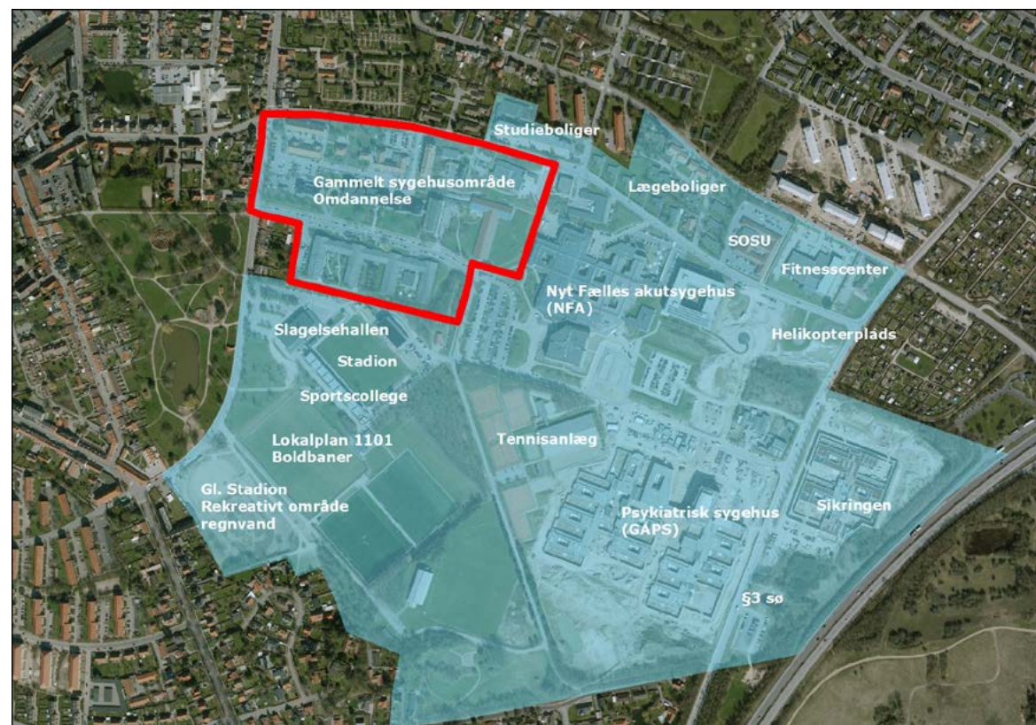
Oversigt over sygehusområdet

Den tidligere sygeplejeskole på Ingemannsvej er ombygget til 144 studieboliger og indviet oktober 2016.