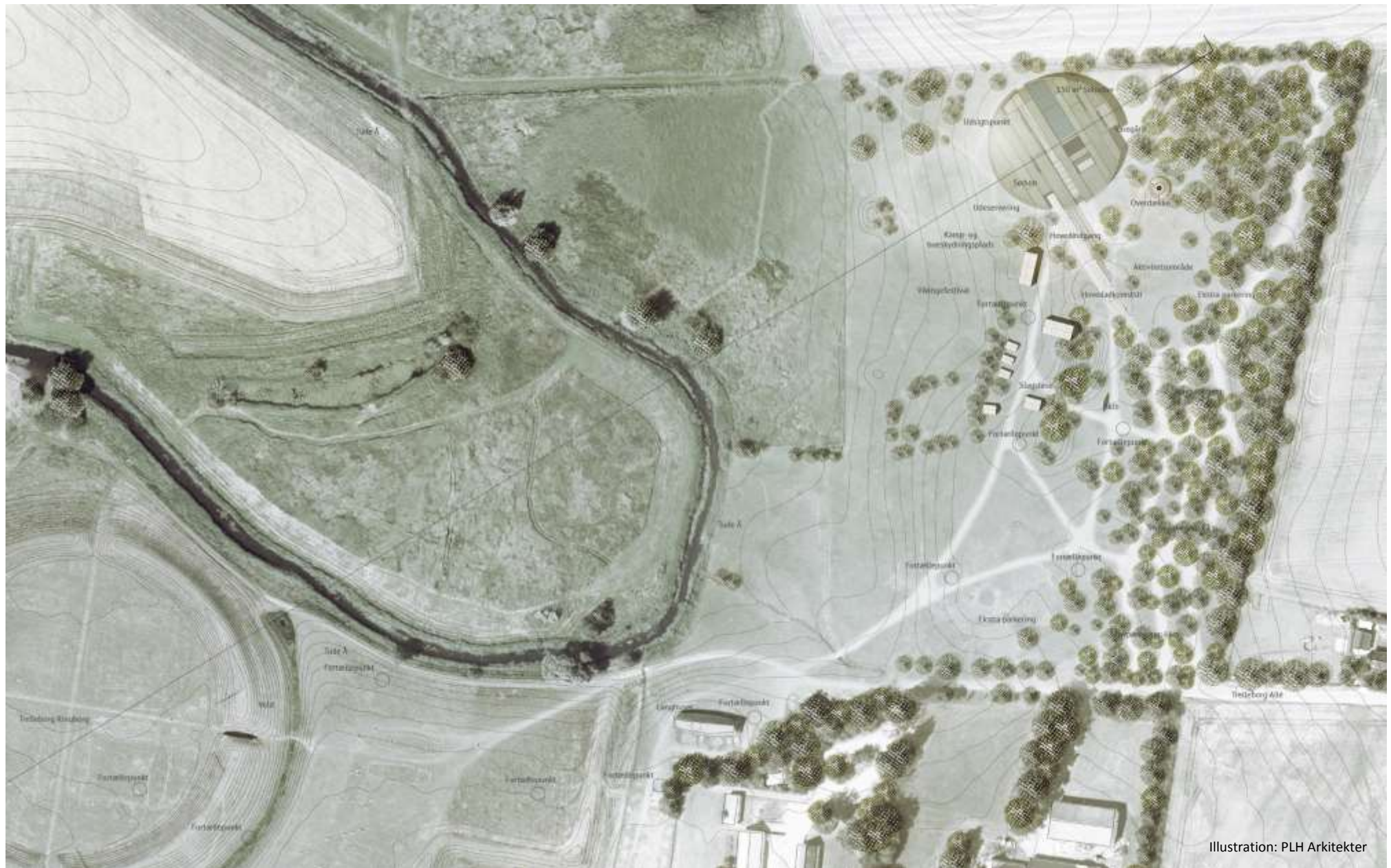
Illustration: PLH Arkitekter