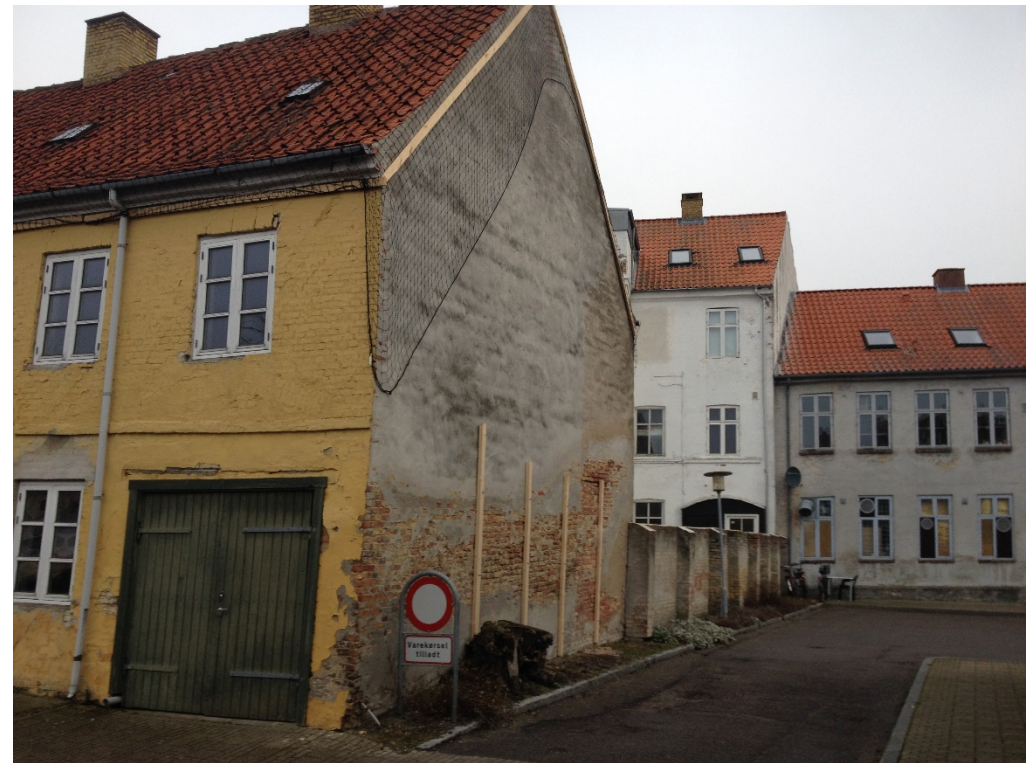
Sådan ser området ud i dag.

En lokalplan skal ledsages af en redegørelse, der beskriver baggrunden, formålet og indholdet i lokalplanen. Herudover beskriver redegørelsen de miljømæssige forhold, forsyningsforhold, forhold til anden planlægning, eksisterende forhold i lokalplanområdet, og om gennemførelse af planlægningen kræver tilladelse og/eller dispensation fra andre myndigheder.