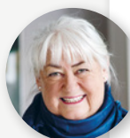
Thyra Frank Ældreminister

De pårørende er plejehjemspersonalets vigtigste samarbejdspartner. De har en livshistorie til fælles med det menneske, som det handler om. Særligt i forhold til demensramte kan de give os en viden, som vi ikke kan få andre steder fra. Hvad er personens livret, går han tidligt eller sent i seng, og hvilke daglige rutiner er vigtige for ham.”