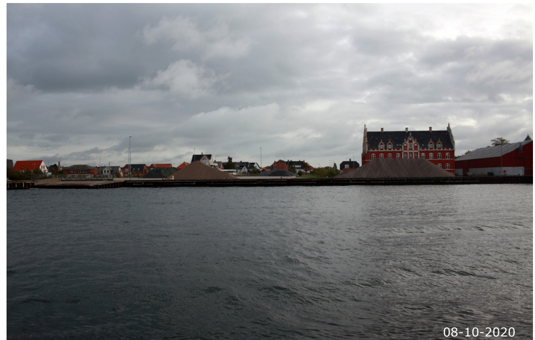
Det tidligere Hotel Storebælt afslutter kulturmiljøet mod øst.