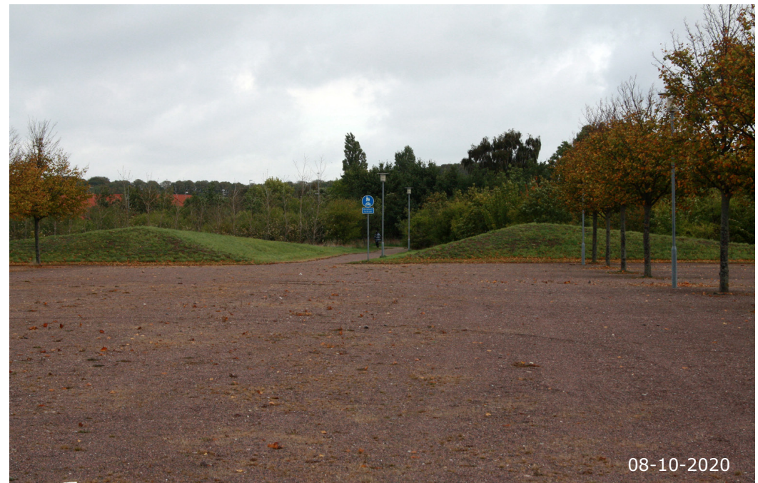
Overgangen fra det tidligere opmarchareal til Korsør Bypark.