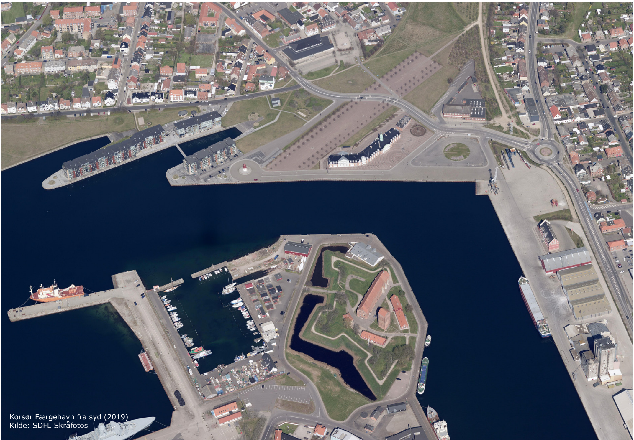
Korsør Færgehavn fra syd (2019)