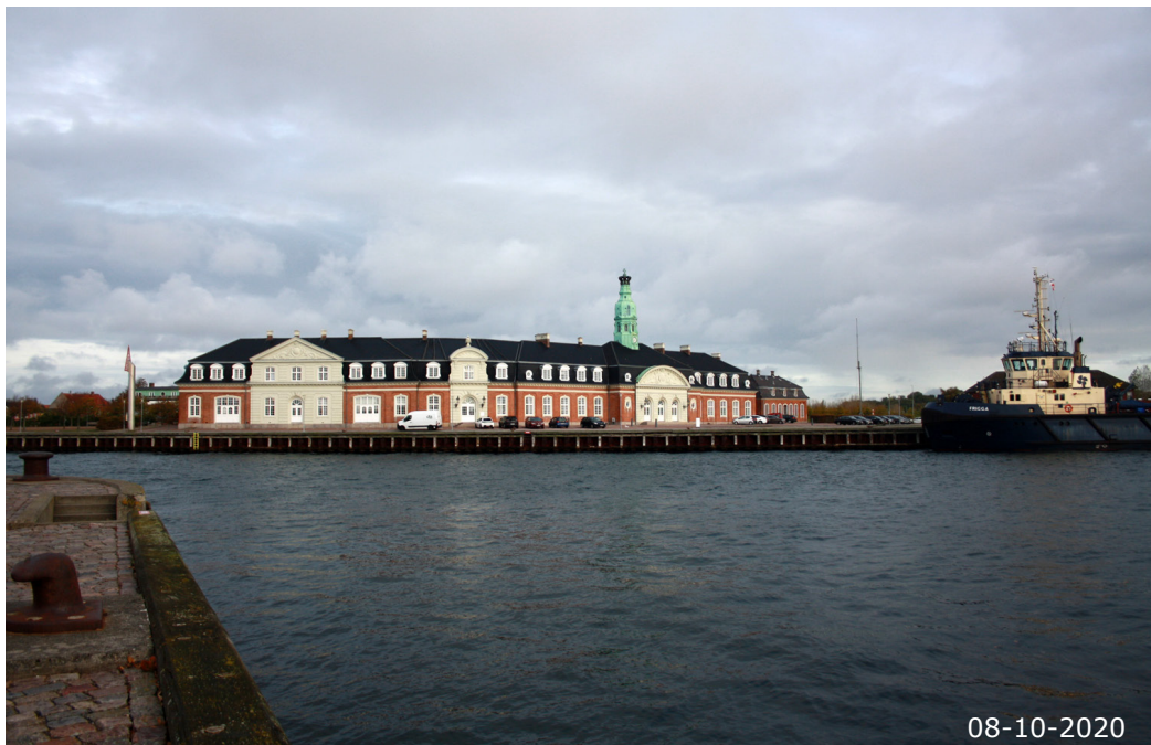
Området for den tidligere færgehavn set fra syd over havnebassinet. Den store skala i bygninger og byrum ses tydeligt på afstand.