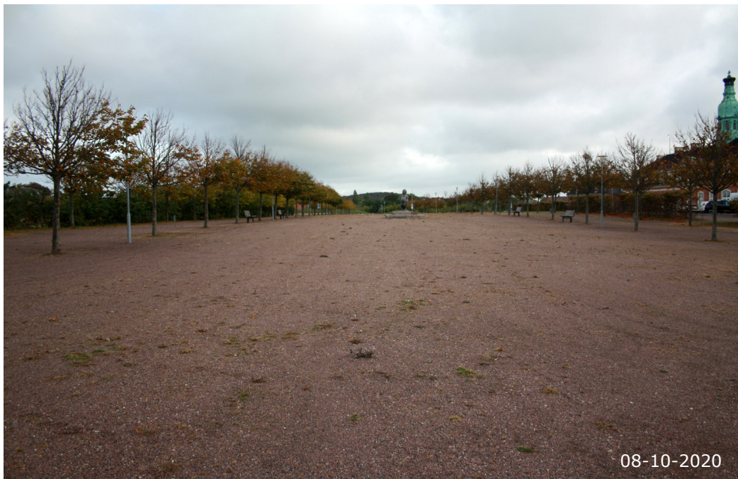
Det tidligere opmarchareal på vestsiden af banegårdsbygningen. Et stort, åbent byrum med høj grad af landskabsbearbejdning.