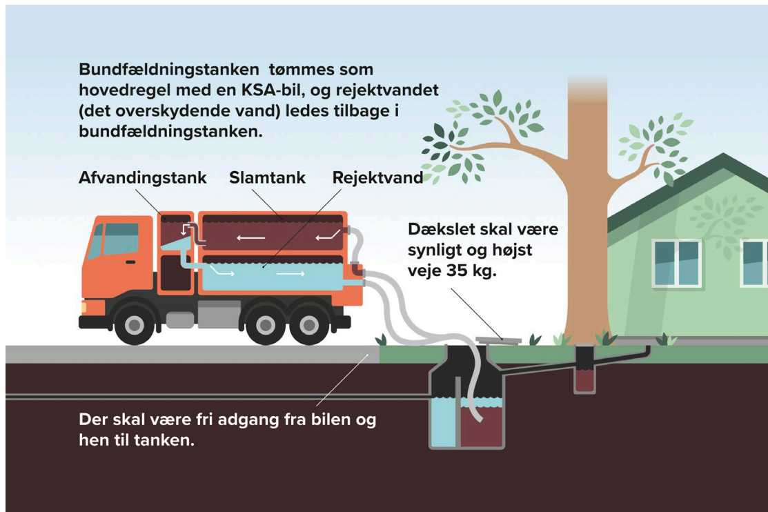
Fig. 4: Kombineret Slam Afvanding med KSA-bil