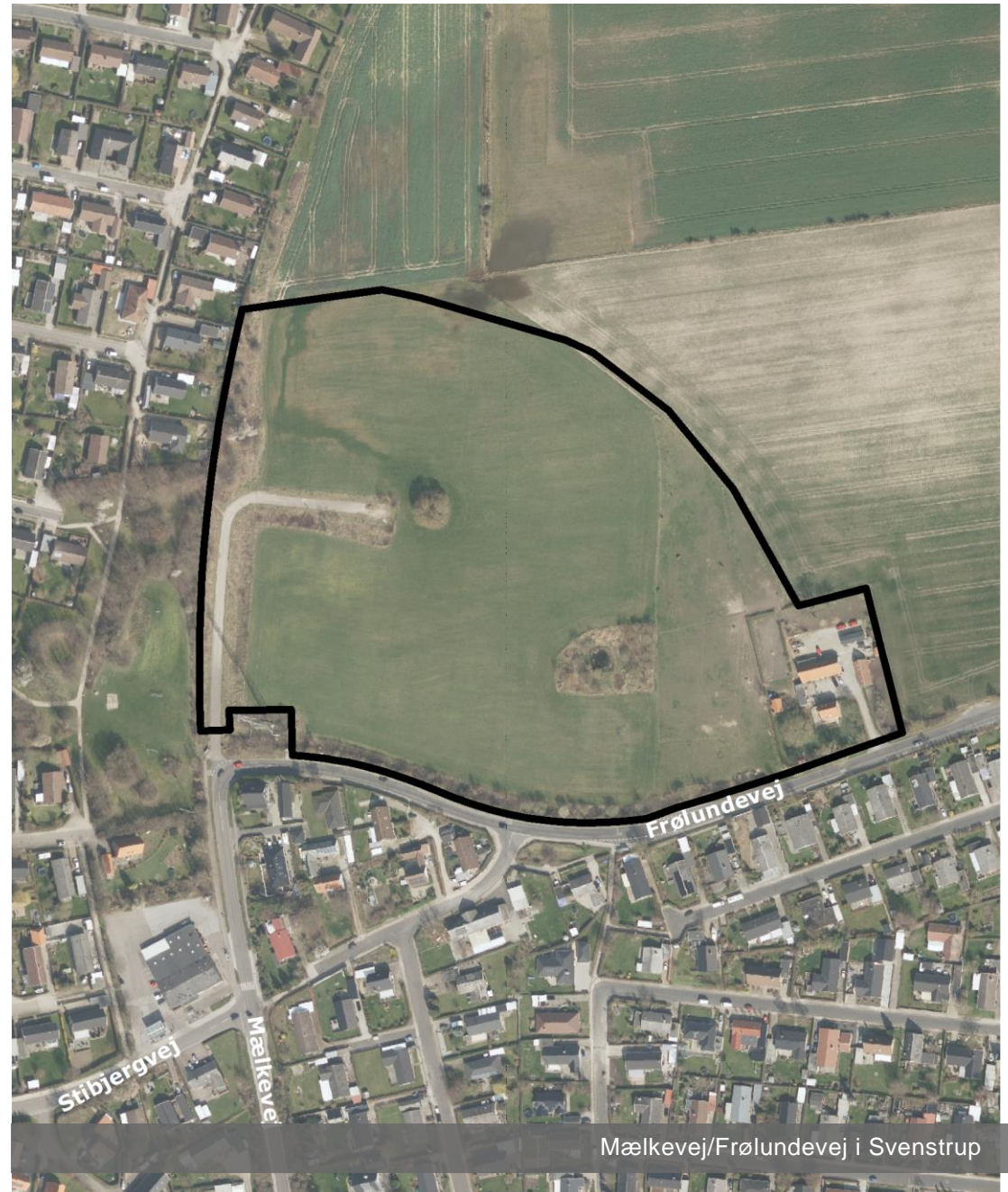
Mælkevej/Frølundvej i Svenstrup

Der er registreret i alt 2 bemærkninger inden for høringsfristen.