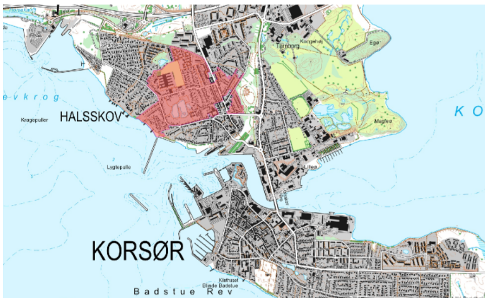
Figur 1 Rød markering viser det område som kystbeskyttelsen dækker.

Denne afgørelse omhandler højvandssikringen af Område 2, som hovedsagelig omfatter en fodring af stranden med ca. 14.000 m 3 sand således, at kystlinjen rykker ca. 15-20 meter søværts, samtidig med der etableres et dige og en mur på land med en topkote på +2,60 meter DVR90.