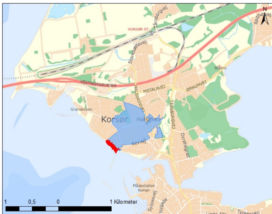
Figur 2 område 2 er vist med blå, kystsikringen er vist med rød markering.

Højvandssikringen af Halsskov er inddelt i tre områder 1, 2 og 3. Det ansøgte anlægsprojekt omhandler sandfordring på stranden samt etablering af et dige med henblik på højvandsbeskyttelse af Halsskov. Område 2 som strækker sig fra roden af havnemolen i Korsør havn og ca. 270 meter mod NV til området ved Sprogøvej.