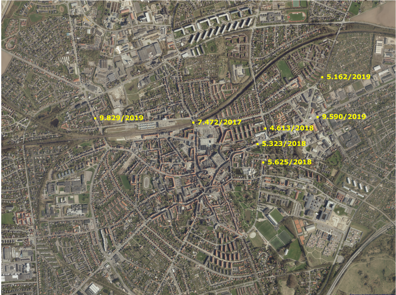
Oversigtskort 2: Antal køretøjer ÅDT og tælleår

Nedenstående kort viser årsdøgnetrafikken (ÅDT) i antal køretøjer ved de seneste trafiktællinger: