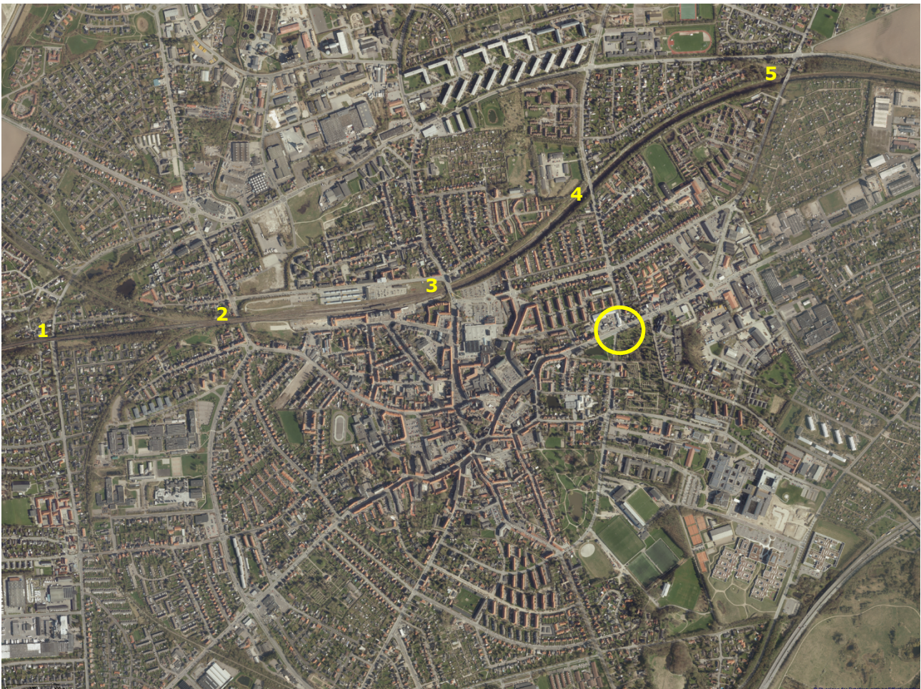
Oversigtskort 1: Markering af punkter hvor der er trafikal forbindelse mellem nord og syd, samt placeringen af krydset Smedegade/Parkvej/Rosenkildevej.