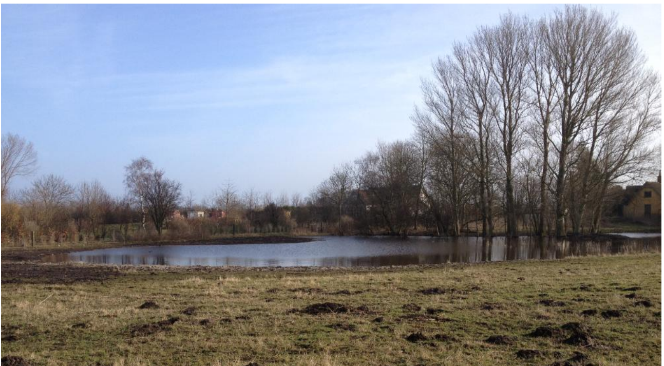
Nyetableret sø på Stignæs. Samme lokalitet, øverste foto foråret 2013, nederste foto foråret 2015!