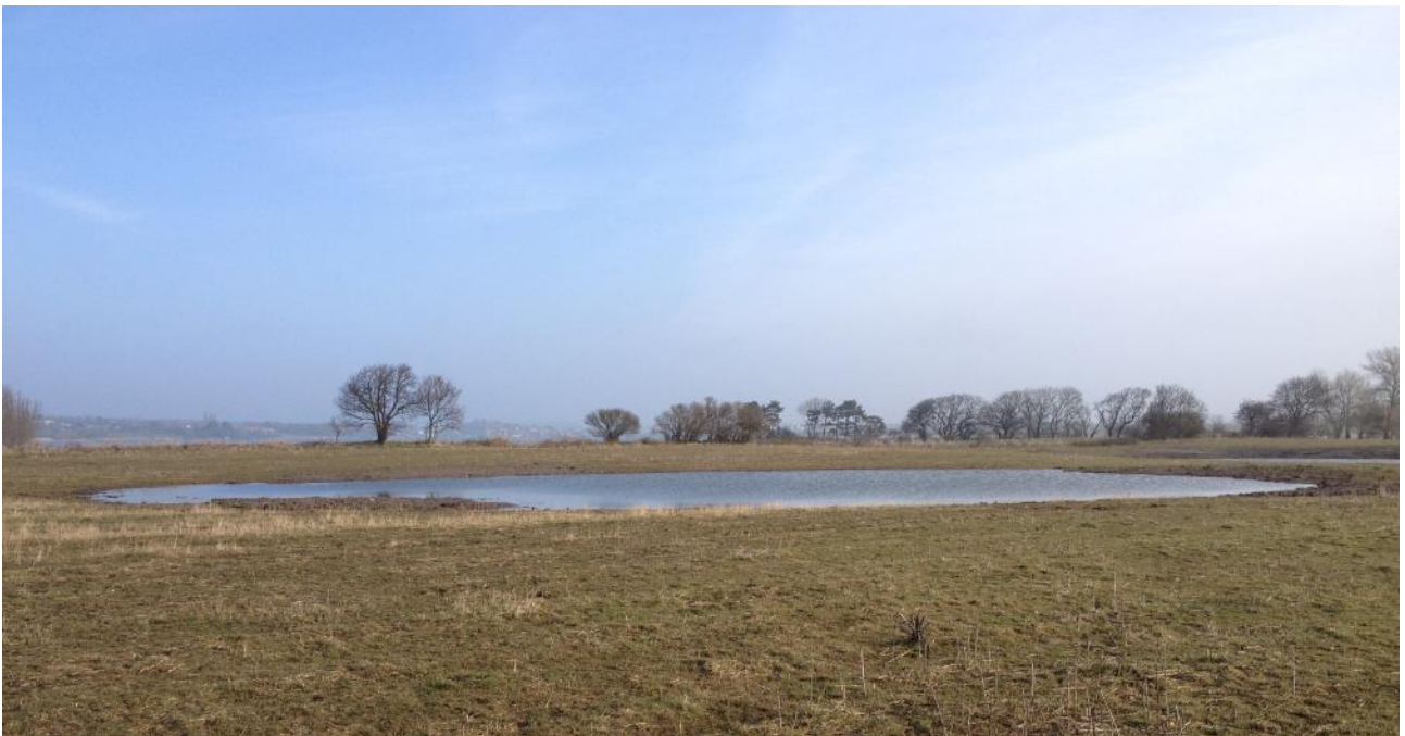
Stignæs, samme lokalitet, øverst forår 2013, nederst forår 2015!