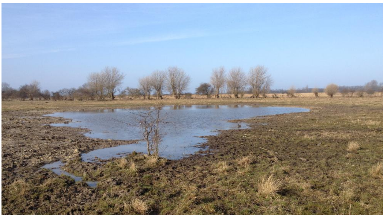
Stignæs, samme lokalitet, øverst forår 2013, nederst forår 2015!