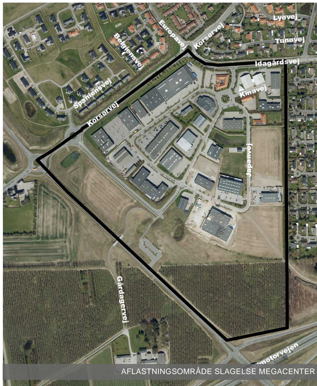
AFLASTNINGSOMRÅDE SLAGELSE MEGACENTER

Planforslaget har været i offentlig høring fra den 2. februar 2018 til den 19. april 2018.