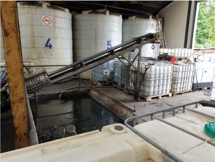
Lagertanke, gultank og palletanke med farligt affald