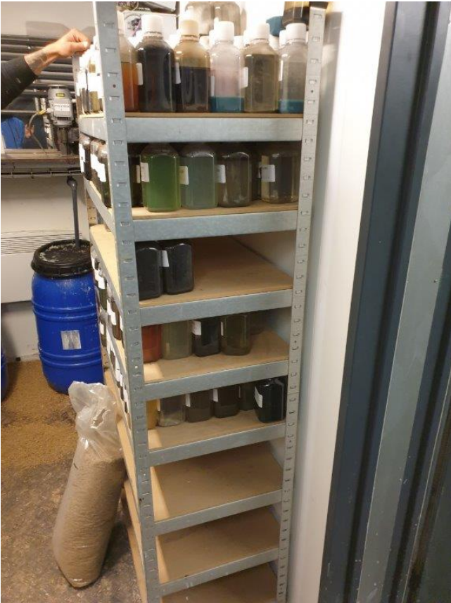
Reol med prøver fra modtaget farligt affald