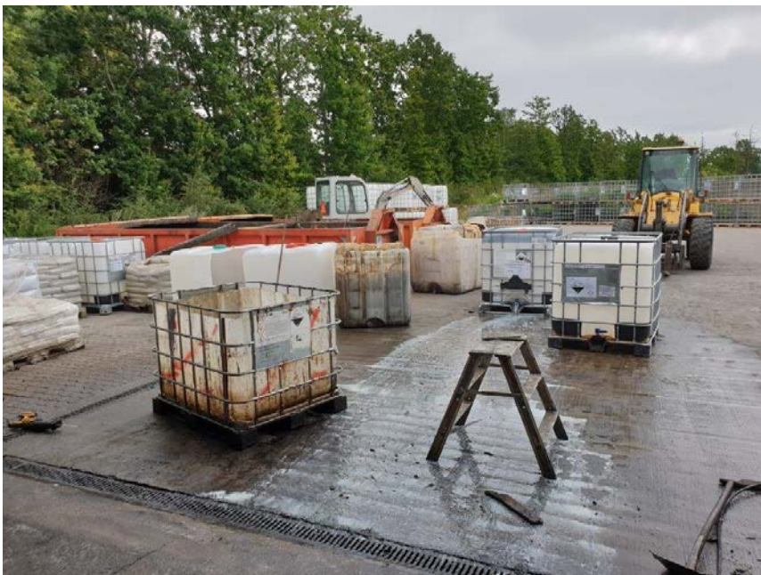
Tømning af farligt affald fra palletanke via riste til gulvtank

Virksomheden var på tilsynstidspunktet i gang med at tømme farligt affald fra palletanke til gulvtank. Slagelse Kommune gjorde opmærksom på risikoen for forurening med neonicotinoide ifm. sammenblandingen af affald.