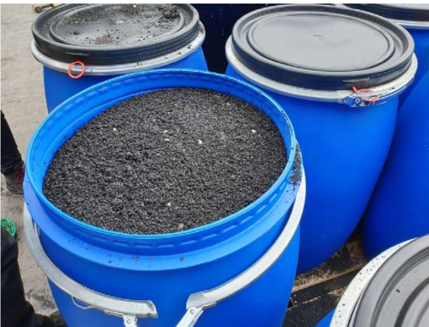
Spændelågsfade med brugt kulfilter materiale

Virksomheden har oplagret 20 blå spændelågsfade med brugt kulfilter materiale. Ifølge virksomheden var spændelågsfadene klargjort til bortskaffelse, Jacob Olsen vidste ikke hvor til.