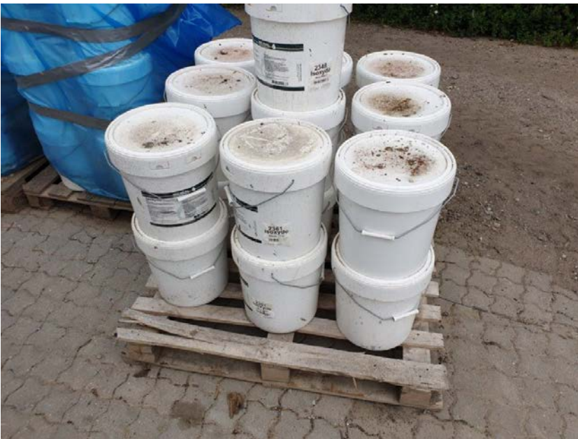
Oplag af kemikalier og hjælpestoffer