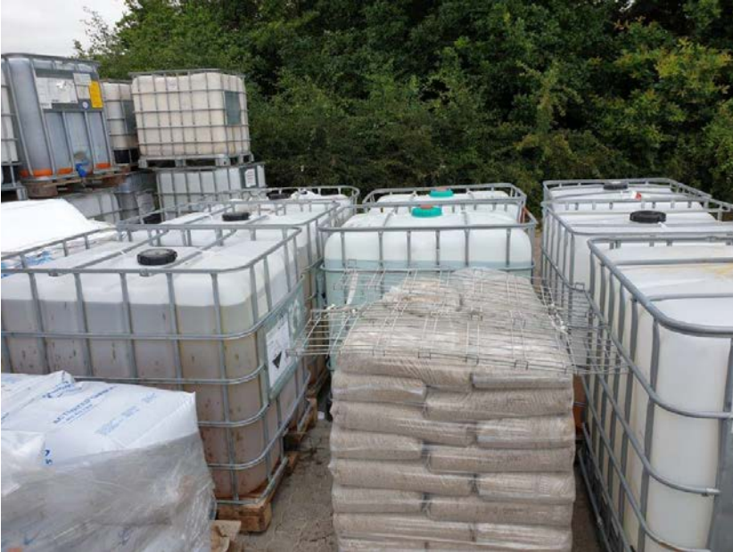
Oplag af kemikalier og hjælpestoffer