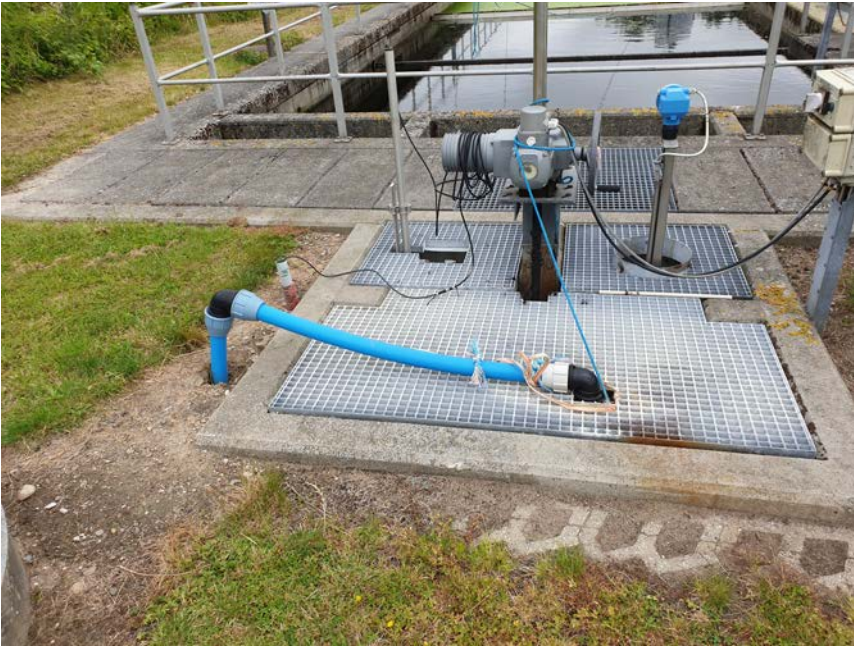
Udløb fra Flux Water til Slagelse Renseanlæg.