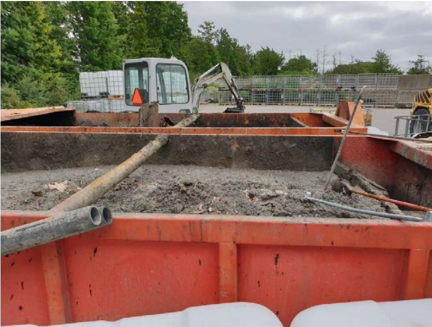
Åbne containere på oplagsplads