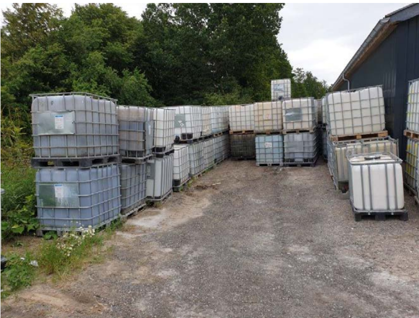
Tomme palletanke på virksomheden