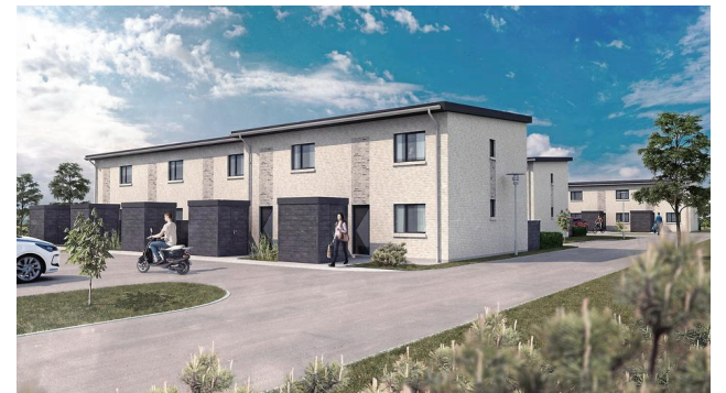
Ill. øv.: Slagelse Bypark. Ill. ned.: Løvegade (Sericolgrunden)