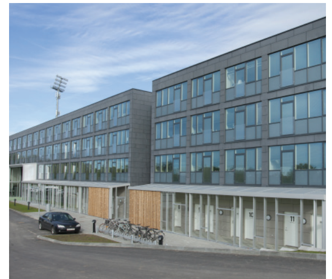
Ill. øv.: Studiebolighuset. Ill. ned.: Stadionparken