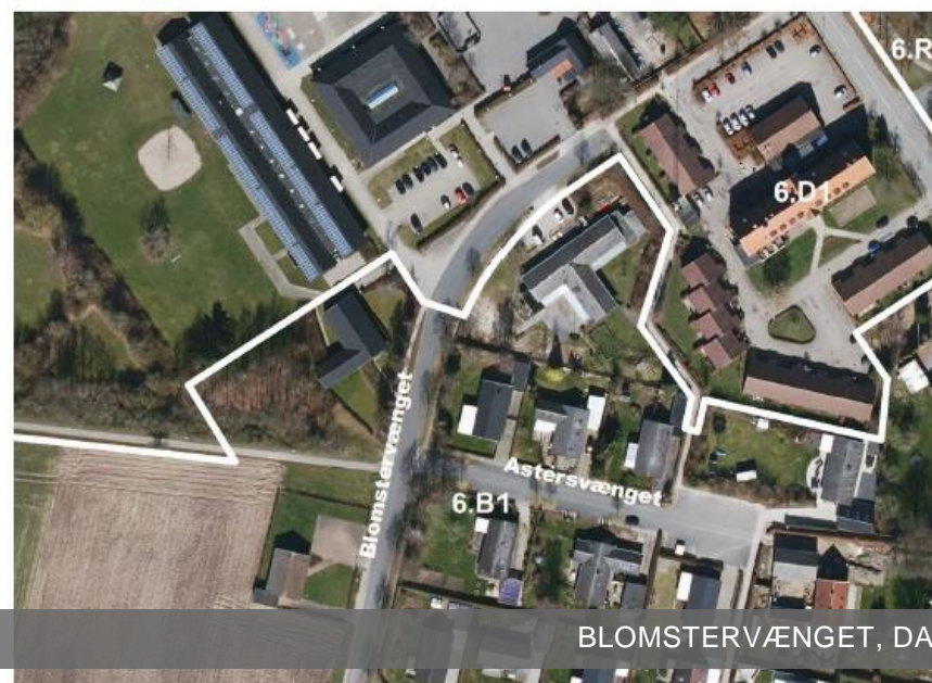
Forslag til ny afgrænsning