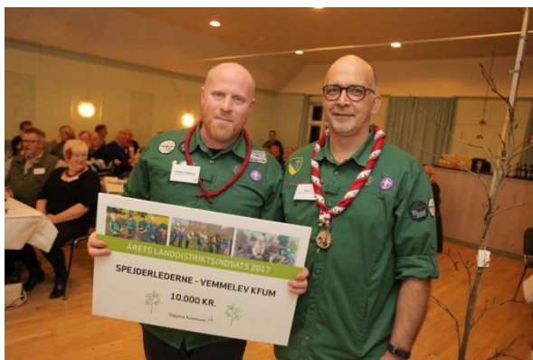
Spejderledere i Vemmelev modtog i 2017 Landdistriktspris

Spejderarbejdet i gruppen har en berettigelse, da den først og fremmest er en opdragende/karakterdannende bevægelse, der kan give udfordringer, oplevelser og friluftsliv, hvor stærkt fællesskab er bærende. Vi gør en indsats for at udvikle børn og unge fysisk, intellektuelt, åndeligt, og følelsesmæssigt.