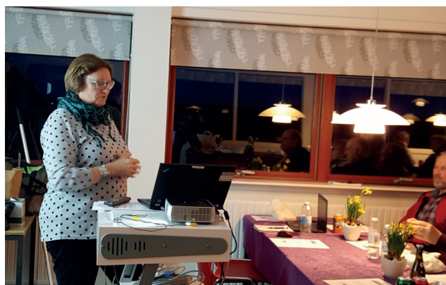
Stormøde på Agersø den 7. marts ??