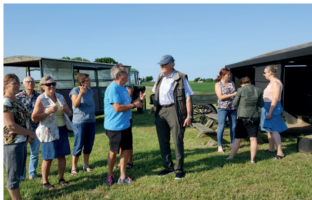
12-12 møde på Agersø