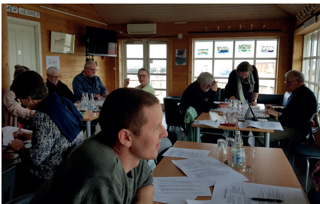
12 - 12 møde på Omø den 28. marts 2019

Manglende kendskab til kommunens bosætningsindsats og mulighed for samspil om tiltrækning af nye borgere til øerne.