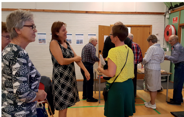
Stormøde på Agersø den 20.09.18

Kroen tilbyder guidede ture til fods og traktorture.