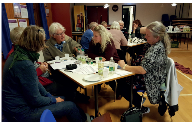
Stormøde på Omø den 3. oktober 2018

Omø som en grøn og bæredygtig ø, handler om at have en natur i balance. Bæredygtighed er i forhold til Omø et spørgsmål om at være selvforsynende. Et af de vigtige temaer, er adgangen til rent drikkevand, og derfor skal der arbejdes for at Omø bliver en giftfri ø. Derfor har Omø Vandværk taget initiativer for at sikre områder omkring grundvandsboringer gennem forpagtning af jord. Omø Vandværk har desuden udsendt en opfordring til landmændene på Omø med tilbud fra Økologisk Landsforening om et gratis omlægningstjek med henblik på at omlægge til økologisk landbrug. Udfordringen ligger i at sikre et sprøjtefrit indvindingsområde – som stort set omfatter hele sydende af øen. Det skal også undersøges om der kan laves samtlige tiltag, som eksempelvis etableringen af solceller på områder omkring grundvandsboringerne, som ikke bliver dyrket. For at styrke naturen blev det foreslået, at der blev opkøbt jord som fællesseje, og som kan anvendes til at dyrkning af afgrøder, så man kan blive selvforsynende.