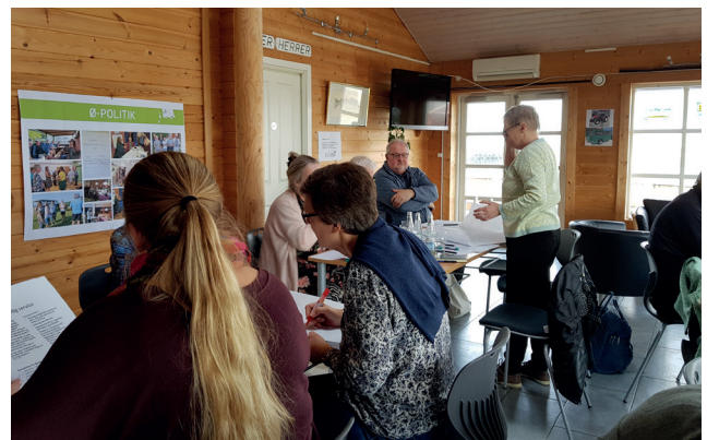
12 - 12 møde på Omø den 28. marts 2019