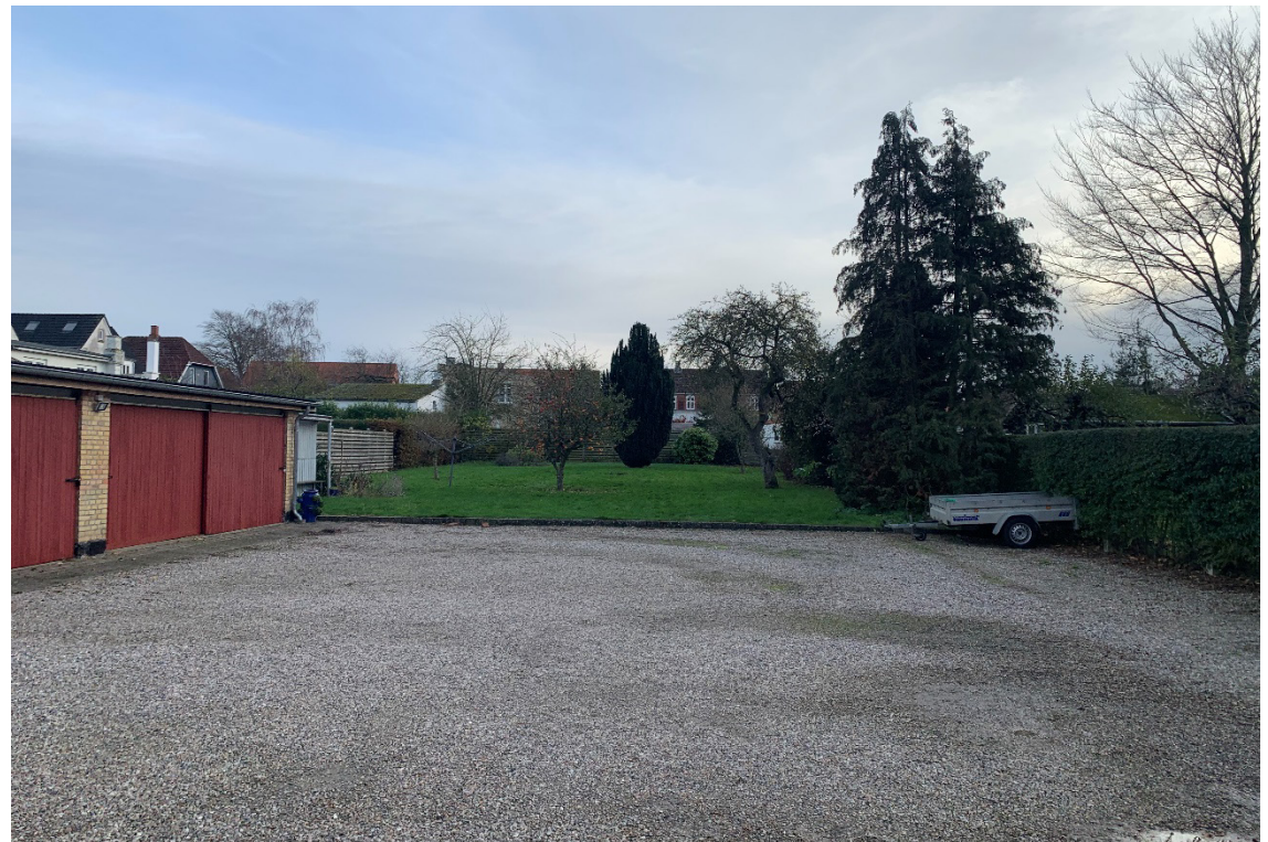
Sådan ser området ud i dag (november 2022).

En lokalplan skal ledsages af en redegørelse, der beskriver baggrunden, formålet og indholdet i lokalplanen. Herudover beskriver redegørelsen de miljømæssige forhold, forsyningsforhold, forhold til anden planlægning, eksisterende forhold i lokalplanområdet, og om gennemførelse af planlægningen kræver tilladelse og/eller dispensation fra andre myndigheder.