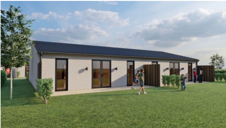
Visualisering af bygningen med 2 boliger.

Visualiseringerne er vejledende og skal betragtes som principvisualiseringer.