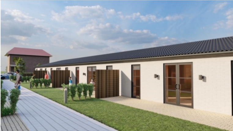
Visualisering af bygningen med 4 boliger.