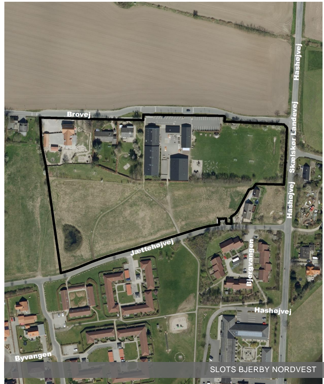
SLOTS BJERBY NORDVEST

Planforslaget har været i offentlig høring fra den 4. maj 2018 til den 29. juni 2018.