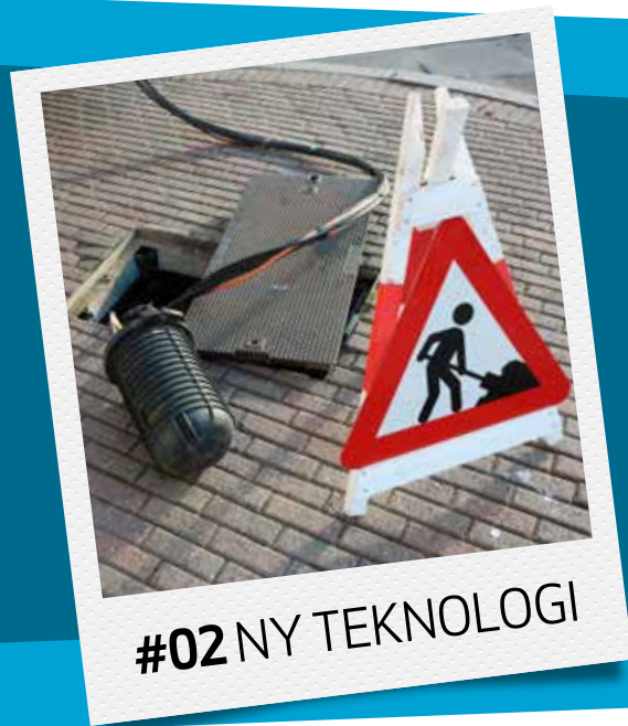
#02 NY TEKNOLOGI

Slagelse Kommune prioriterer at alle borgere i kommunen har mobildekning og adgang til fibernet. Det er nødvendigt for at kunne tiltrække og fastholde borgere. Og for at sikre erhvervslivet gode vilkår. Reglerne for kommunens mulighed for engagement i projekter omkring mobiltelefoni og fibernet er dog udfordret af lovgivningen. Men så tager borgerne sagen i egen hånd. Det har de gjort på Omø og i Eggeslevmagle, hvor de nu har fået fibernet.