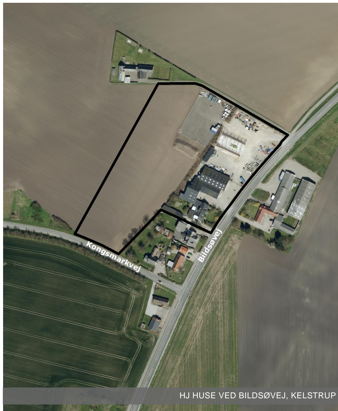
HJ HUSE VED BILDSØVEJ, KELSTRUP

Planforslaget har været fremlagt i offentlig høring fra den 1. juni 2018 til den 29. juni 2018.