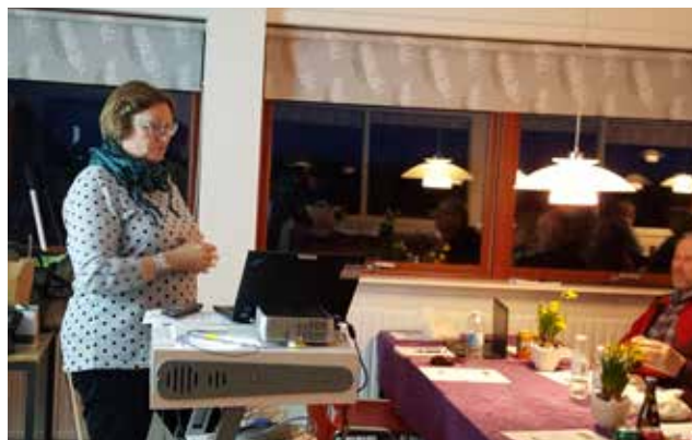
Stormøde på Agersø den 7. marts ??