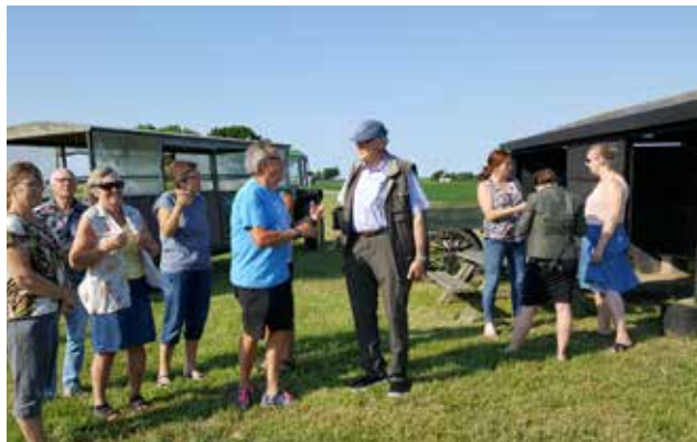
12-12 møde på Agersø