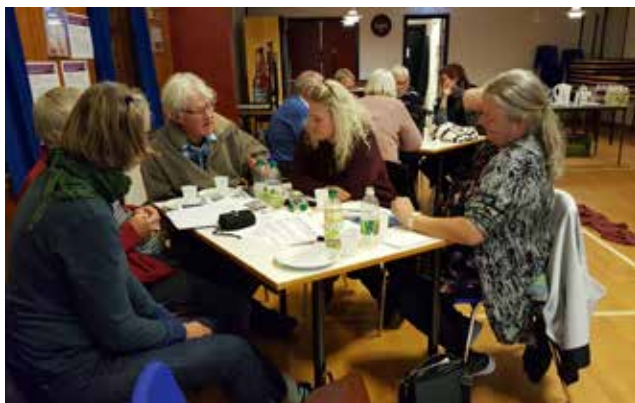
Stormøde på Omø den 3. oktober 2018

Omø som en grøn og bæredygtig ø, handler om at have en natur i balance. Bæredygtighed er i forhold til Omø et spørgsmål om at være selvforsynende. Et af de vigtige temaer, er adgangen til rent drikkevand, og derfor skal der arbejdes for at Omø bliver en giftfri ø. Derfor har Omø Vandværk taget initiativer for at sikre områder omkring grundvandsboringer gennem forpagtning af jord. Omø Vandværk har desuden udsendt en opfordring til landmændene på Omø med tilbud fra Økologisk Landsforening om et gratis omlægningstjek med henblik på at omlægge til økologisk landbrug. Udfordringen ligger i at sikre et sprøjtefrit indvindingsområde – som stort set omfatter hele sydende af øen. Det skal også undersøges om der kan laves samtlige tiltag, som eksempelvis etableringen af solceller på områder omkring grundvandsboringerne, som ikke bliver dyrket. For at styrke naturen blev det foreslået, at der blev opkøbt jord som fællesej, og som kan anvendes til at dyrkning af afgrøder, så man kan blive selvforsynende.