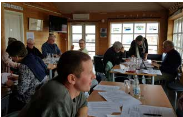
12 - 12 møde på Omø den 28. marts 2019

Manglende kendskab til kommunens bosætningsindsats og mulighed for samspil om tiltrækning af nye borgere til øerne.