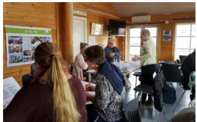
12 - 12 møde på Omø den 28. marts 2019