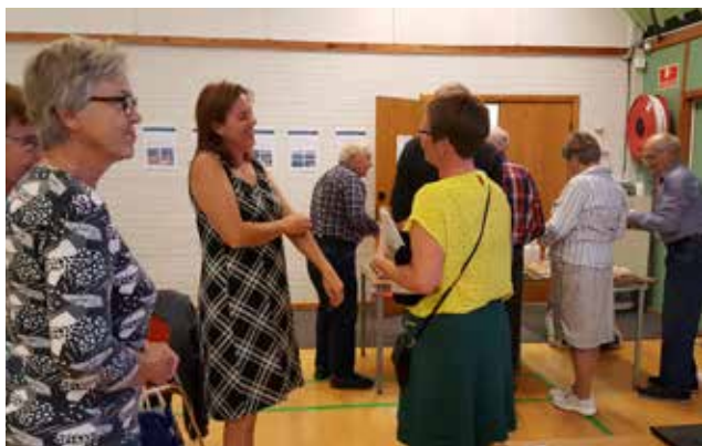
Stormøde på Agersø den 20.09.18

Kroen tilbyder guidede ture til fods og traktorture.