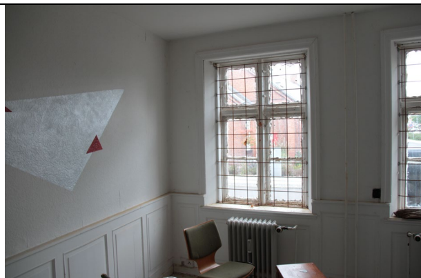
Døre og vinduer nedbrudte og ikke brugbare.