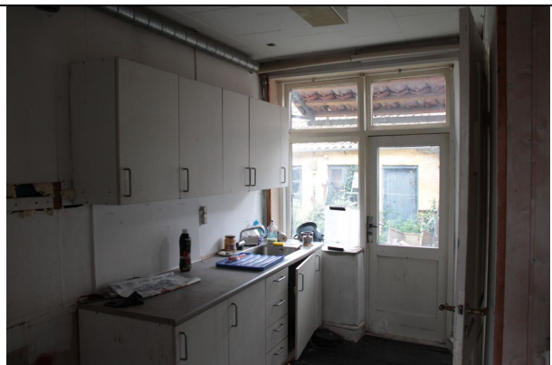
Køkken i stueetage.