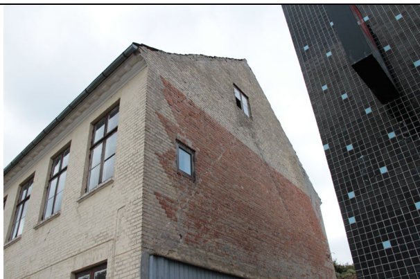
Flere sætningsrevner i gavl.