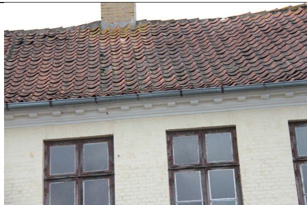
Tagkonstruktion er nedbrudt med synlig nedbøjning og svigt i styrke.