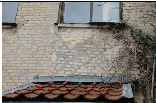
På bagsiden af bygning ses ligeså revner op gennem facade fra fundament.