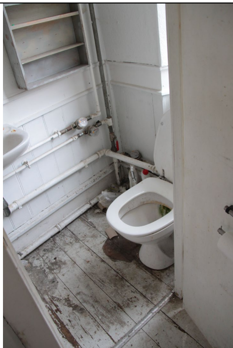
Toilet og bad i stueetage. Gulve nedbrudte og generelt uegnet til bolig. Råd i gulv og bjælkelag.