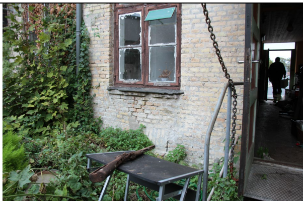
På bagsiden af bygning ses ligeså revner op gennem facade fra fundament.