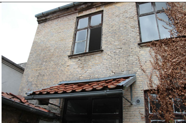
Gennemgående revner i facade.