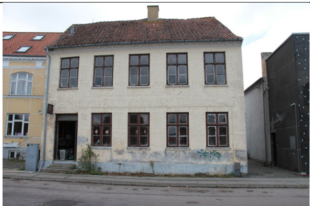
Facade har flere sætningsrevner opstået fra fundament.