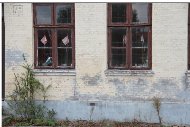
Revner fra fundament af sylsten går op igennem facade.