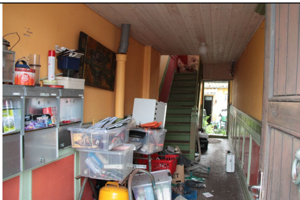
Generelt uegnet og tidssvarende til bolig.