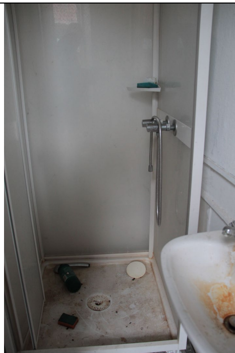
Badekabine opsat i foran toilet.