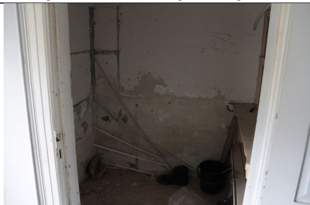
Del af bolig.