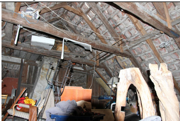
Tagkonstruktion svækket og forsøgt afstivet med påføring af taglægter og regler på spær.