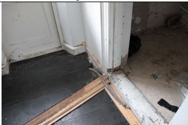
Nyere gulve lagt på oprindelige skæve og svækkede gulve og konstruktion.