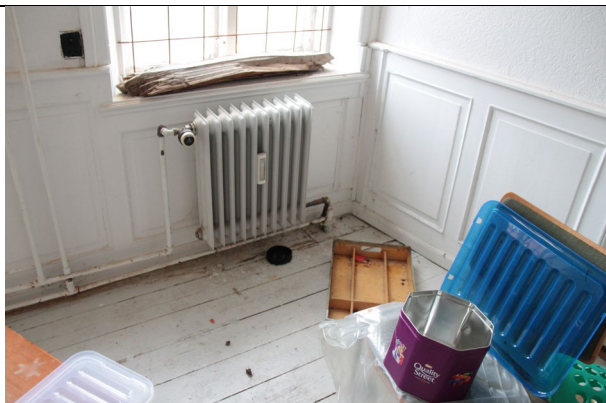
Gulve og bærebjælke nedbrudte og skæve. Tåler ikke større belastning.