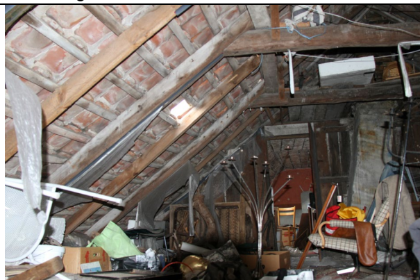
Svækket og nedbrudt takonstruktion.