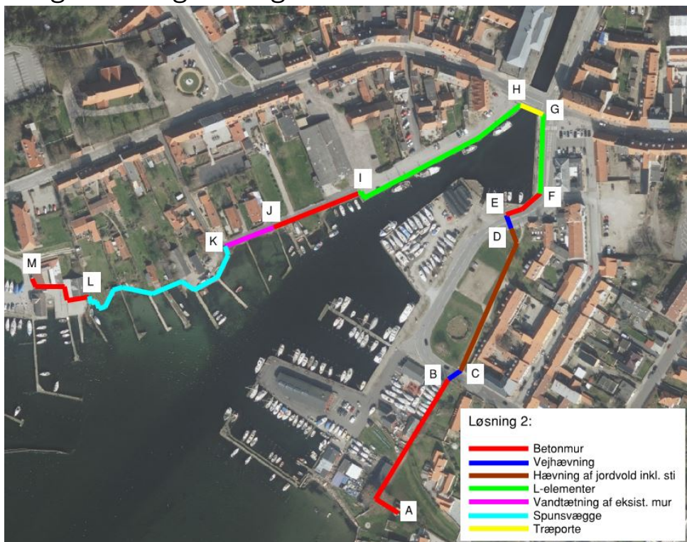
Figur 1: Sikringsforslag 2, linjeføring og principper for sikring af havnen.