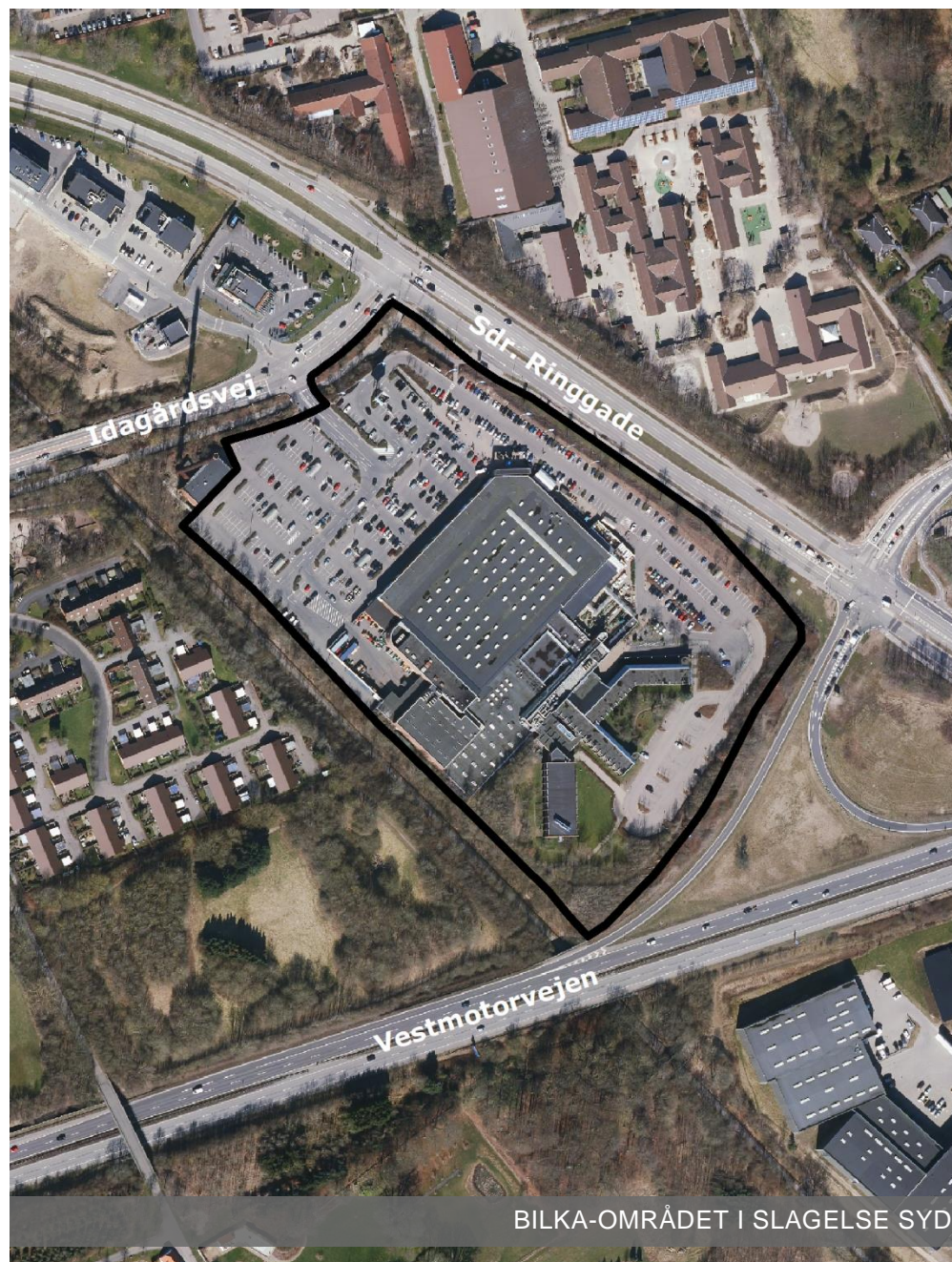
BILKA-OMRÅDET I SLAGELSE SYD

Planforslaget har været i offentlig høring fra den 21. december 2018 til den 15. februar 2019.