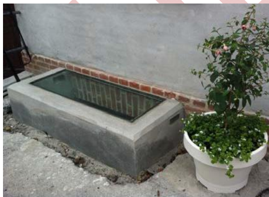
Figur 2: Lyskasse med skybrudssikring og glas

Regnvand fra lyskasser skal som udgangspunkt separeres, men separering kan undlades, hvis de overdækkes med glas eller plexiglas og skybrudssikres. Grundejer skal oplyses om, at afløb i lyskasser skal afproppes for at undgå risikoen for opstuvning af spildevand fra kloakken ved skybrud.