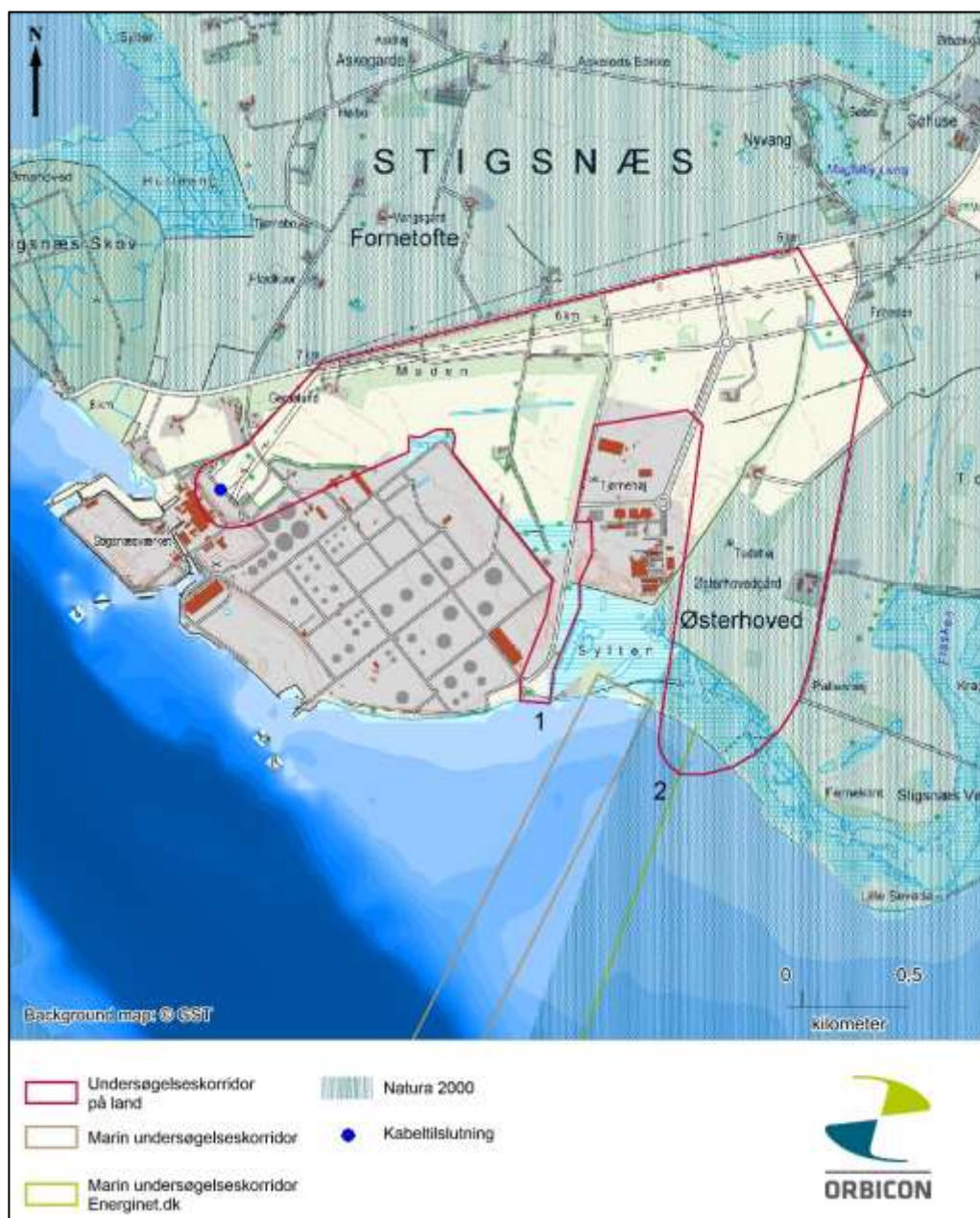
Figur 8.1.1 Områder der med ovenstående retningslinjer reserveres til kabelanlæg.