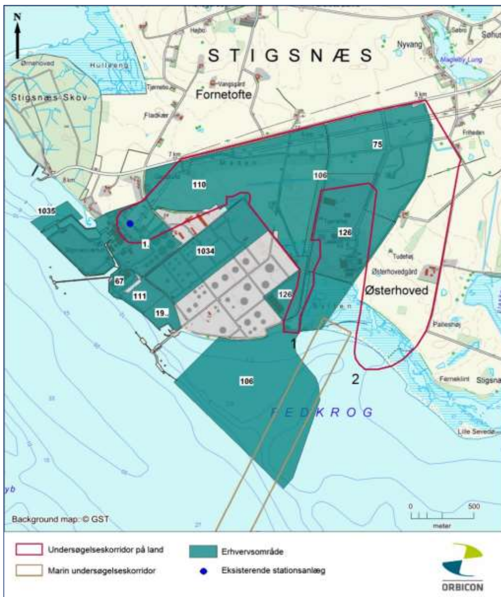
Figur 5.2.1 Lokalplaner