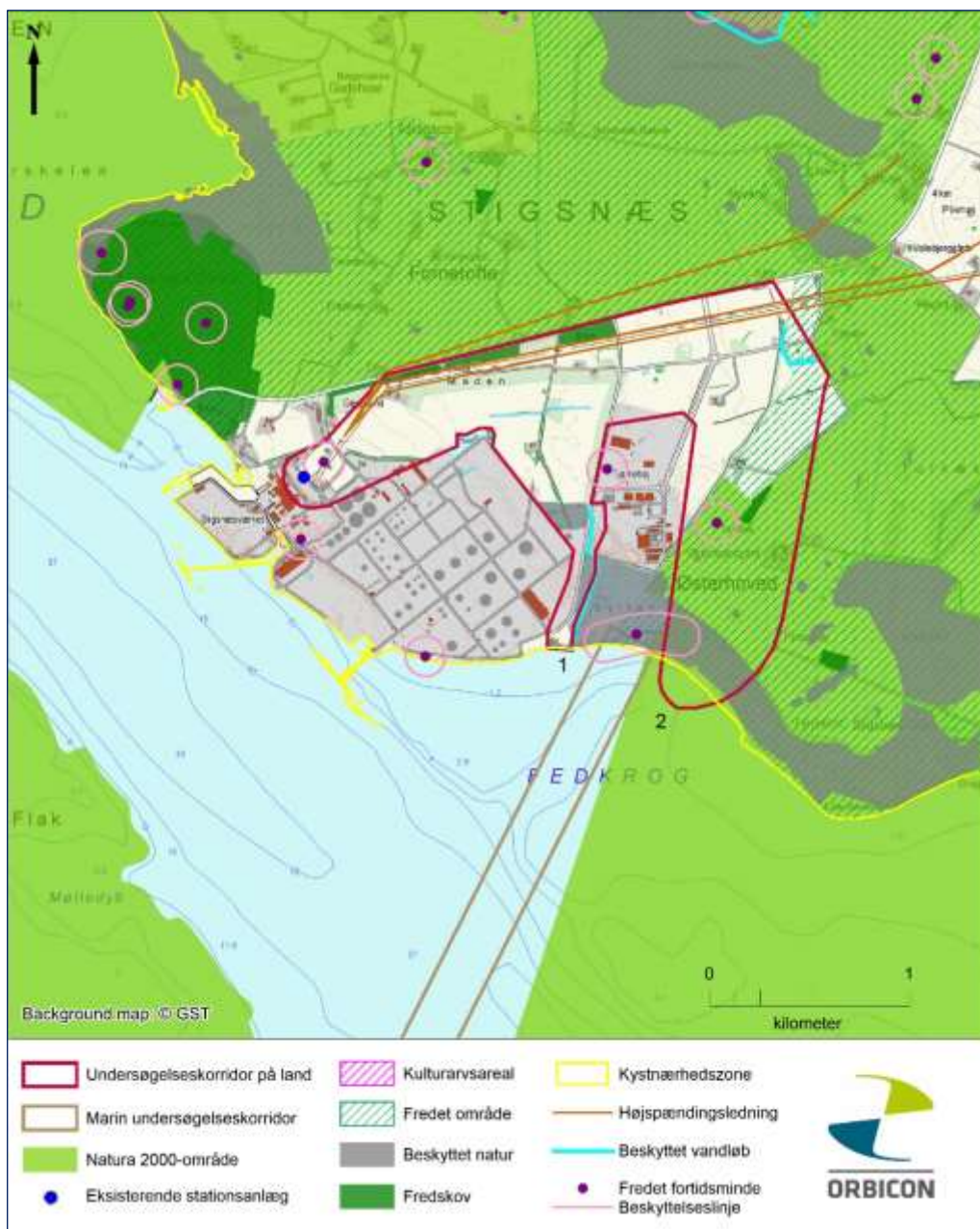
Figur 7.6.1 Bygge- og beskyttelseslinjer, herunder fortidsmindebeskyttelseslinje