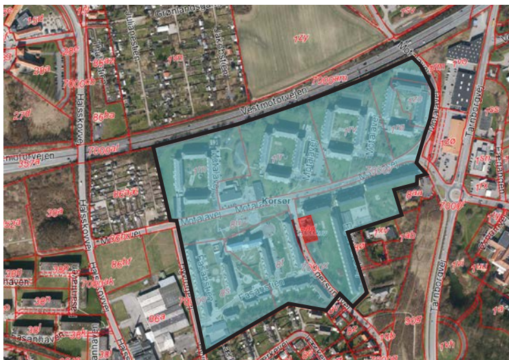
Kort 1. Afgrænsning af Motalavej og ejerforhold

Ud af de 1023 personer mellem 18-64 år, der er inden for den arbejdsdygtige alder, er over halvdelen erklæret uden for arbejdsstyrken. Antallet af arbejdsløse er dog faldet fra 120 i 2013 til 88 i 2016. Og antallet af beskæftigede er steget fra 327 i 2014 til 375 i 2017.