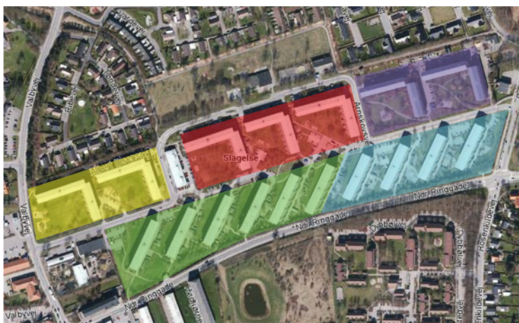
Kort 4. Ringparkens boligafdelinger