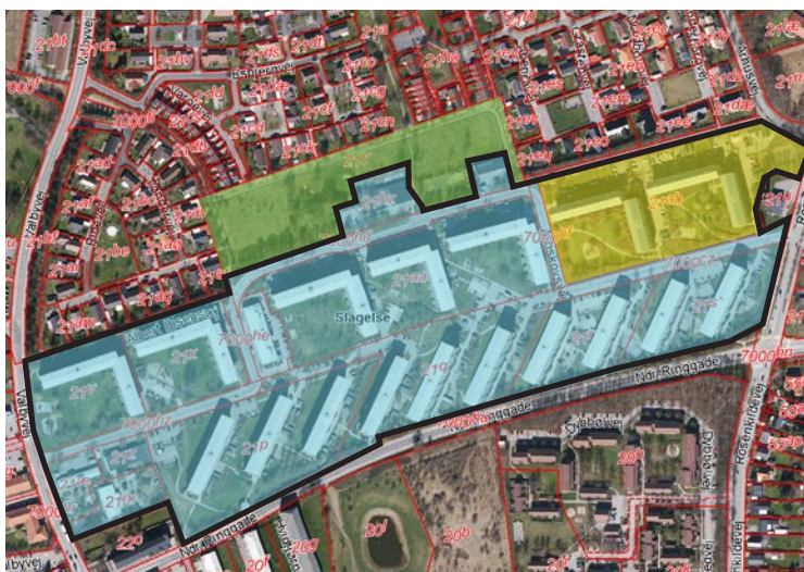
Kort 1. Afgrænsning af Ringparken og ejerforhold

Ud af de 1220 personer mellem 18-64 år, der er inden for den arbejdsdygtige alder, er over halvdelen erklæret uden for arbejdsstyrken. Antallet af arbejdsløse er dog faldet en smule, og der er sket en stigning i antallet af beskæftigede.