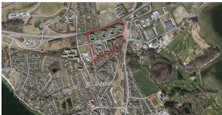
Kort 3. Motalavejs placering i forhold til Korsør by