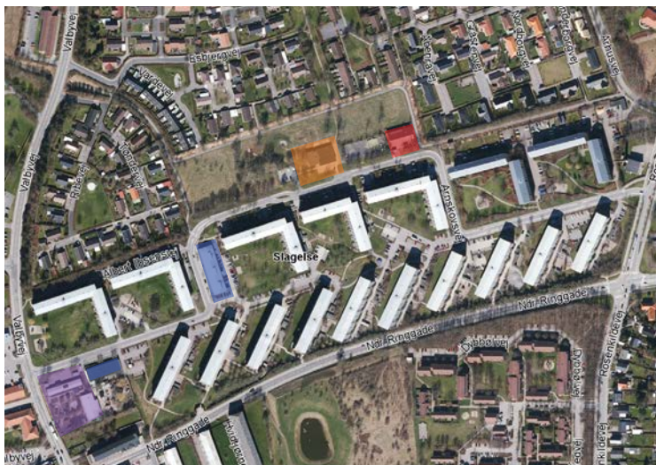
Kort 2. Funktioner i Ringparken