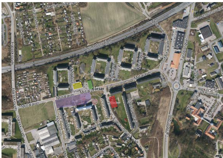
Kort 2. Funktioner på Motalavej