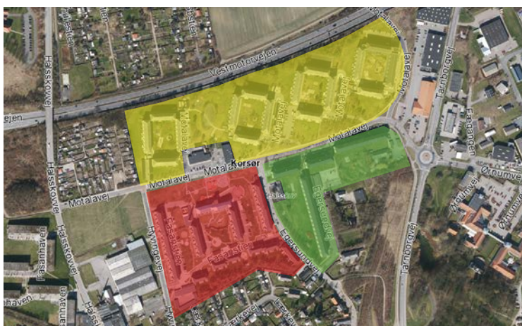
Kort 4. Motalavejs boligafdelinger