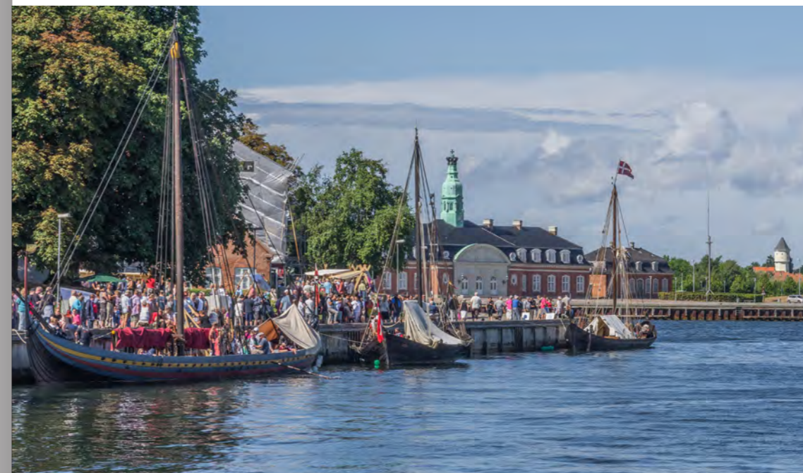
Korsør har allerede meget af det, som tilflyttere sætter pris på - f.eks. naturen og events.