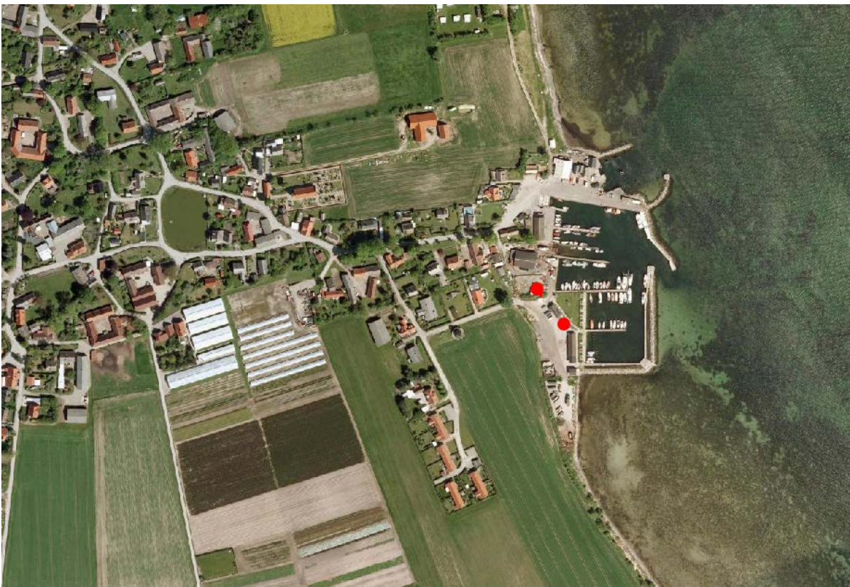
Oversigtskort med de to ønskede grillbarer indtegnet.- bagest i notatet vises et detaljeret kort.

På det kommunalt ejede areal længere mod syd ønsker lystbådeforeningen at leje/ købe et areal til opførelse af en ny grillbar. Se kortbilag nedenfor.