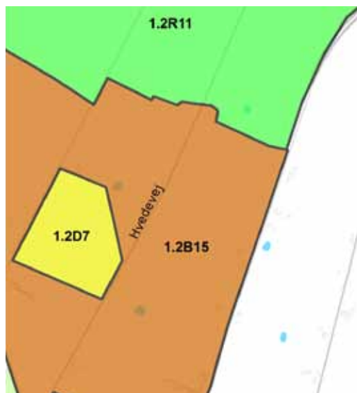
Udsnit af rammeområde 1.2B15 og 1.2R11 - efter vedtagelsen.