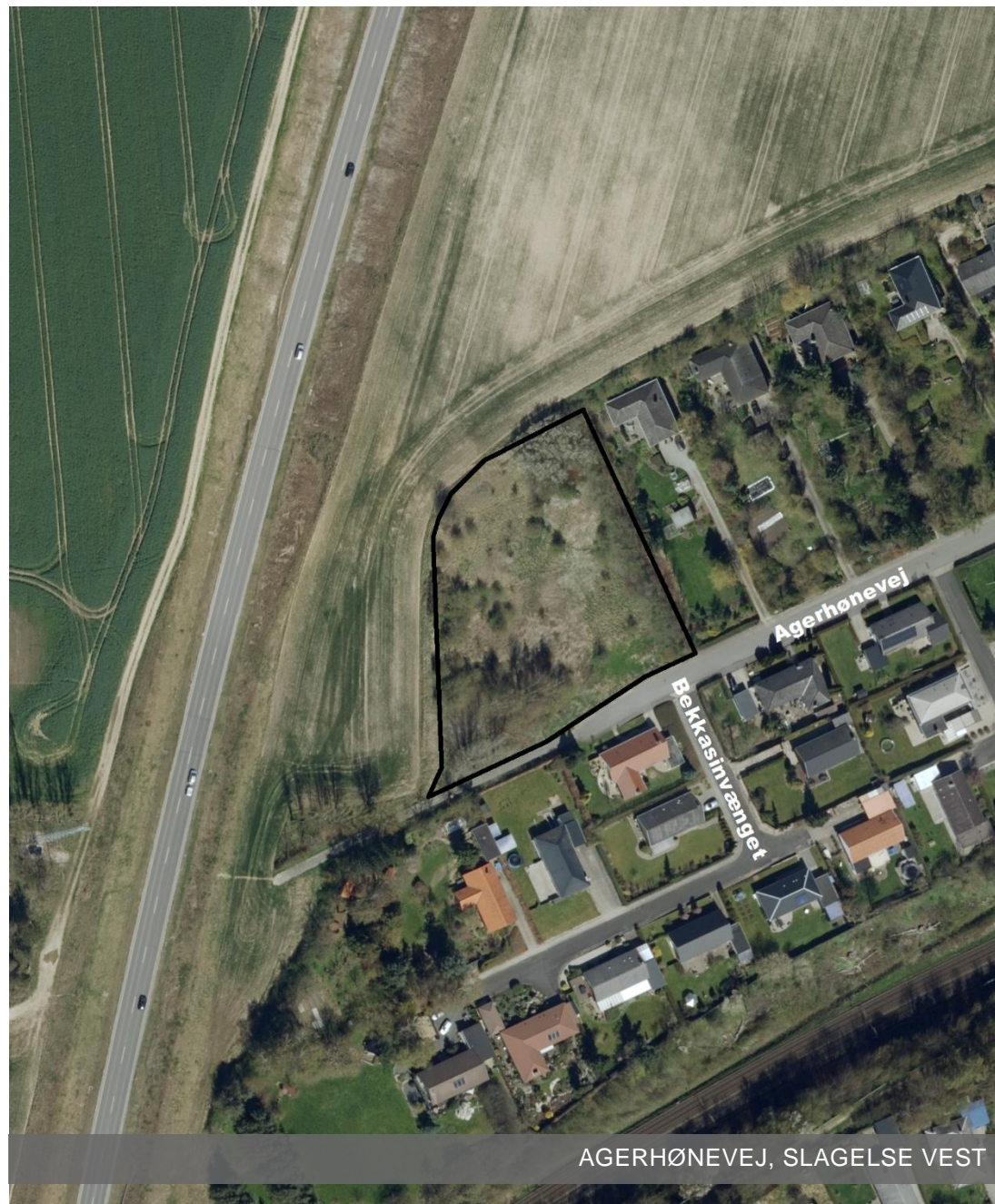
AGERHØNEVEJ, SLAGELSE VEST

Planforslaget har været i offentlig høring fra den 4. maj 2018 til den 29. juni 2018.