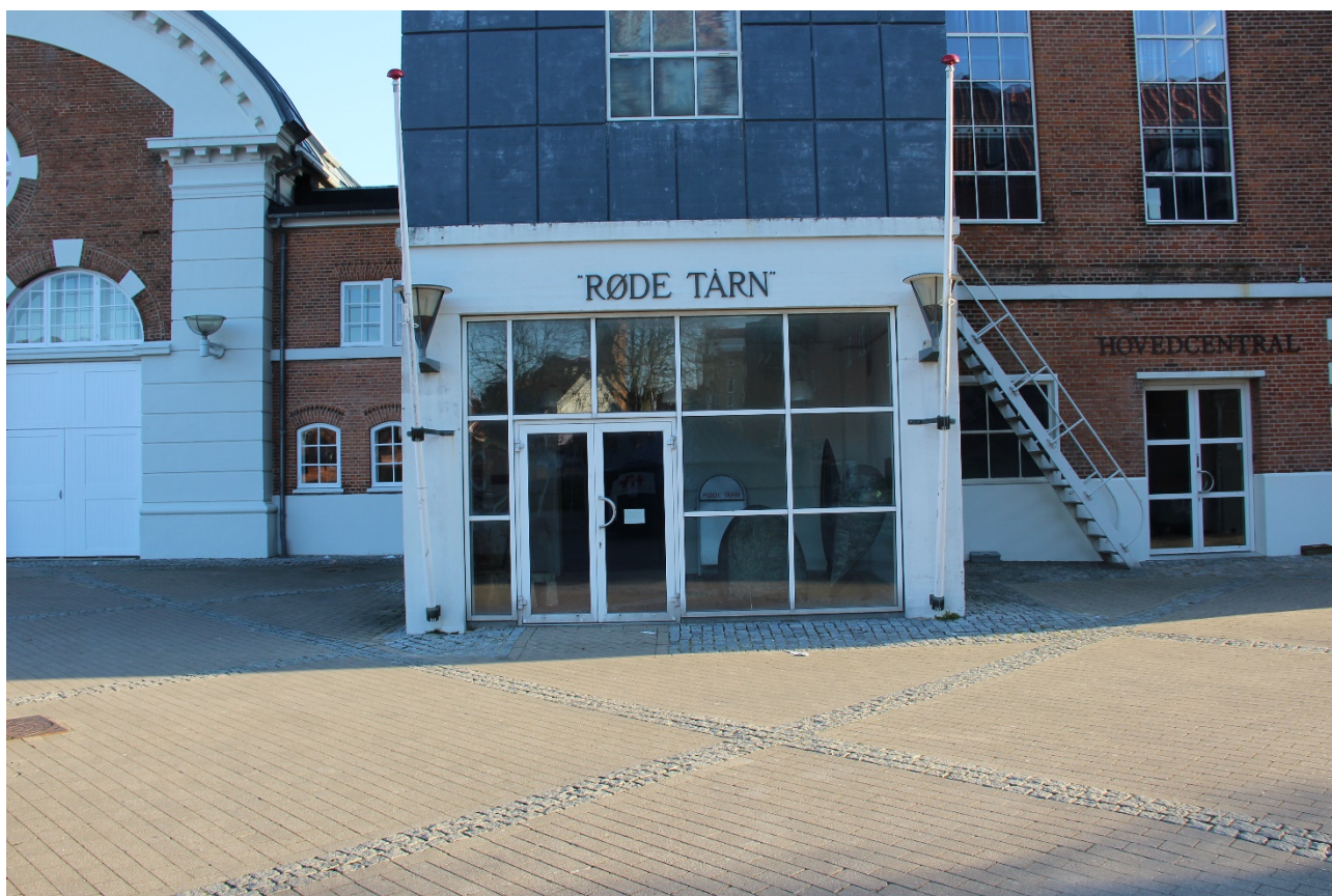
Røde Tårn, Slagelse

På den ene side skal vi være professionelle i arbejdet med kommunens kulturtilbud og skabe gode oplevelser for borgerne. Samtidig skal vi skabe muligheder for, at vores borgere kan være aktive medskabere i kulturen.