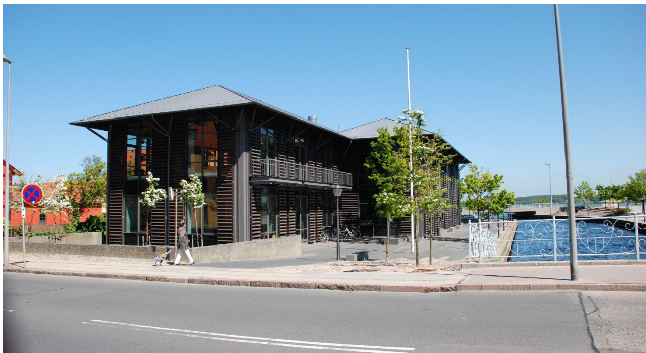
Bibliotek og Borgerservice, Skælskør

Slagelse Biblioteker og Borgerservice har stort fokus på den løbende udvikling af tilbuddet, så borgerne også fremover oplever bibliotekernes kulturtilbud som relevant og vedkommende. I disse år sker der blandt andet en betydelig udvikling på det digitale område, og i forhold til at anvende biblioteksrummet til meget andet og mere end opbevaring af bøger. Desuden er der en udvikling henimod, at biblioteket ved udvidelse af åbningstiden stilles til rådighed for borgerne i forøget omfang.