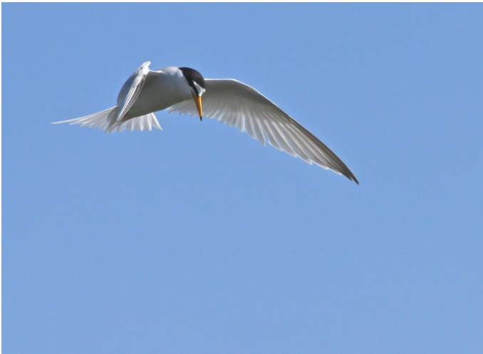
Dværgterner yngler på Lejodde.