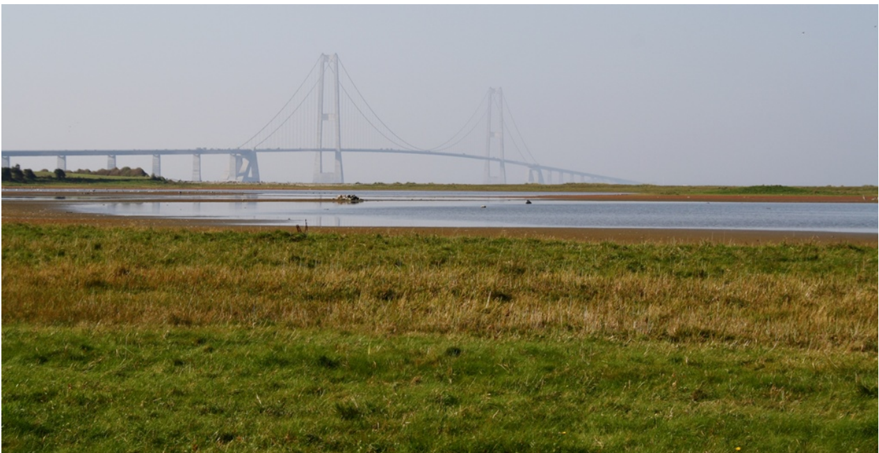
Foto: Lejsø med omkringliggende strandenge på Lejodde nord for Korsør.

Sprogø, Vresen og de mange tilstødende stenrev udgør en fortsættelse af det nord-sydgående bakkestrøg, der løber gennem Langeland og videre i en bue fra Lohals til Korsør.