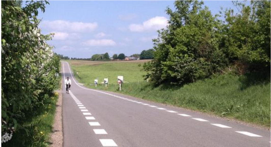
Figur 3: Reference foto af tilsvarende vejstrækning som er afmærket som 2 minus 1 vej

En 2 minus 1 vej er en vej, som visuelt kun har én vognbane, der benyttes af trafikanter i begge retninger, og hvor der er etableret brudte kantlinjer i begge sider af vejen (se Figur 3).