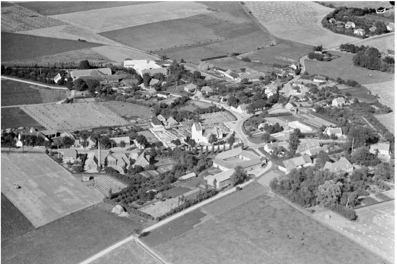
Sørbymagle i perioden 1946-1969.

Efter kommunesammenlægningen 1. april 1966 blev der lavet en udstykning nordøst for Sørbymagle , hvor der blev opført et nyt villakvarter. Den gamle landsbys struktur blev dog bevaret og eksisterer den dag i dag. Foruden kirken og forsamlingshuset, som stadig er i brug, vidner mange bygninger om et liv, der ikke længere eksisterer. Der har været mejeri, bager, købmandsforretning, høkerhandel, slagterbutik, skomagere, røgeri, telefoncentral, posthus, landsbysmed, cykelsmed og to banker. Missionshuset ligger overfor den nedlagte skole – bygninger som i dag er indrettet til boliger.