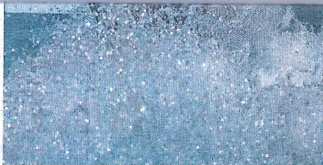
Aqua Park i Slagelse skal være et komplet vandsportsanlæg, hvor motion, bevægelse, elitesport, behandling og genoptræning kan eksistere sammen med turisme, leg og event-industri.