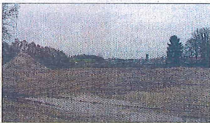
Hunsballe-grunden i Slagelse Syd ejes af kommunen - og er nu bragt i spil som et muligt hjemsted for Aqua Park.

- Det vigtigste for mig er, at planerne om Aqua Park ikke kommer til at drukne i en diskussion om placering. Det vigtigste er, at projektet bliver gennemført, slutter han.