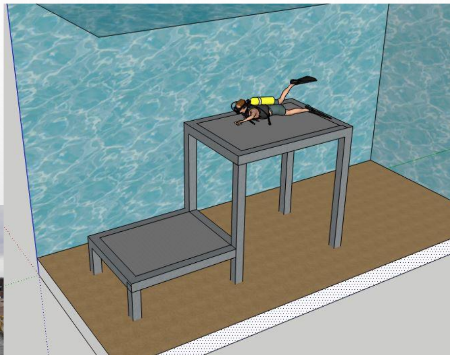
FOTO 3 DYKKERPLATFORM