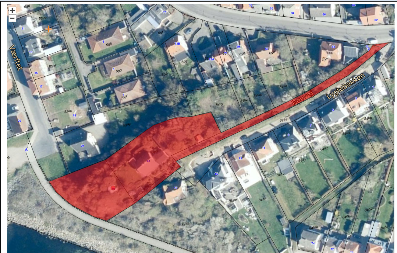
Forventede lokalplanområde markeret med rødt