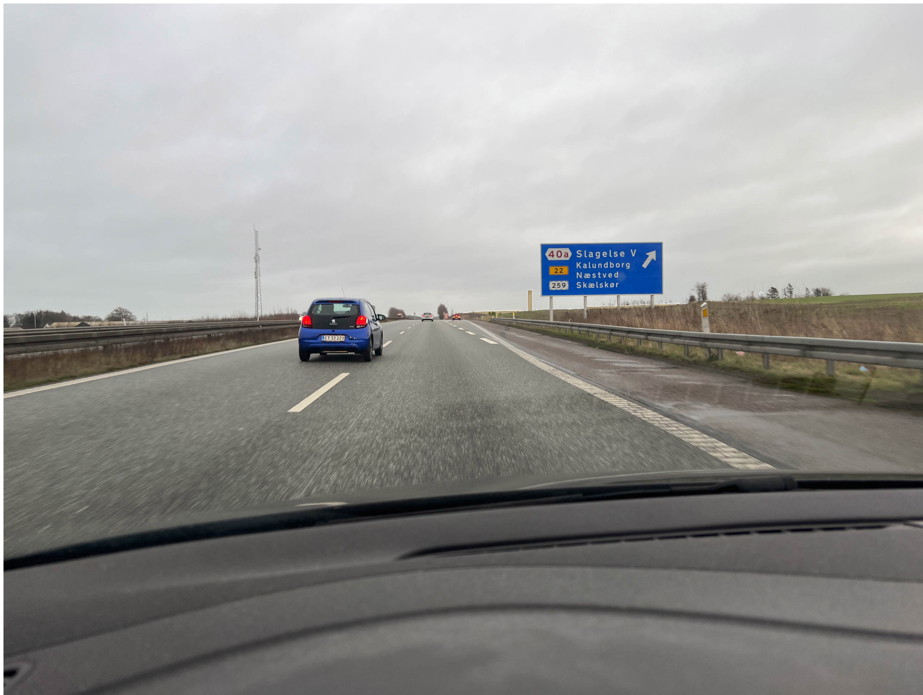
30 meter pylon på vestlig placering, fotostandpunkt b