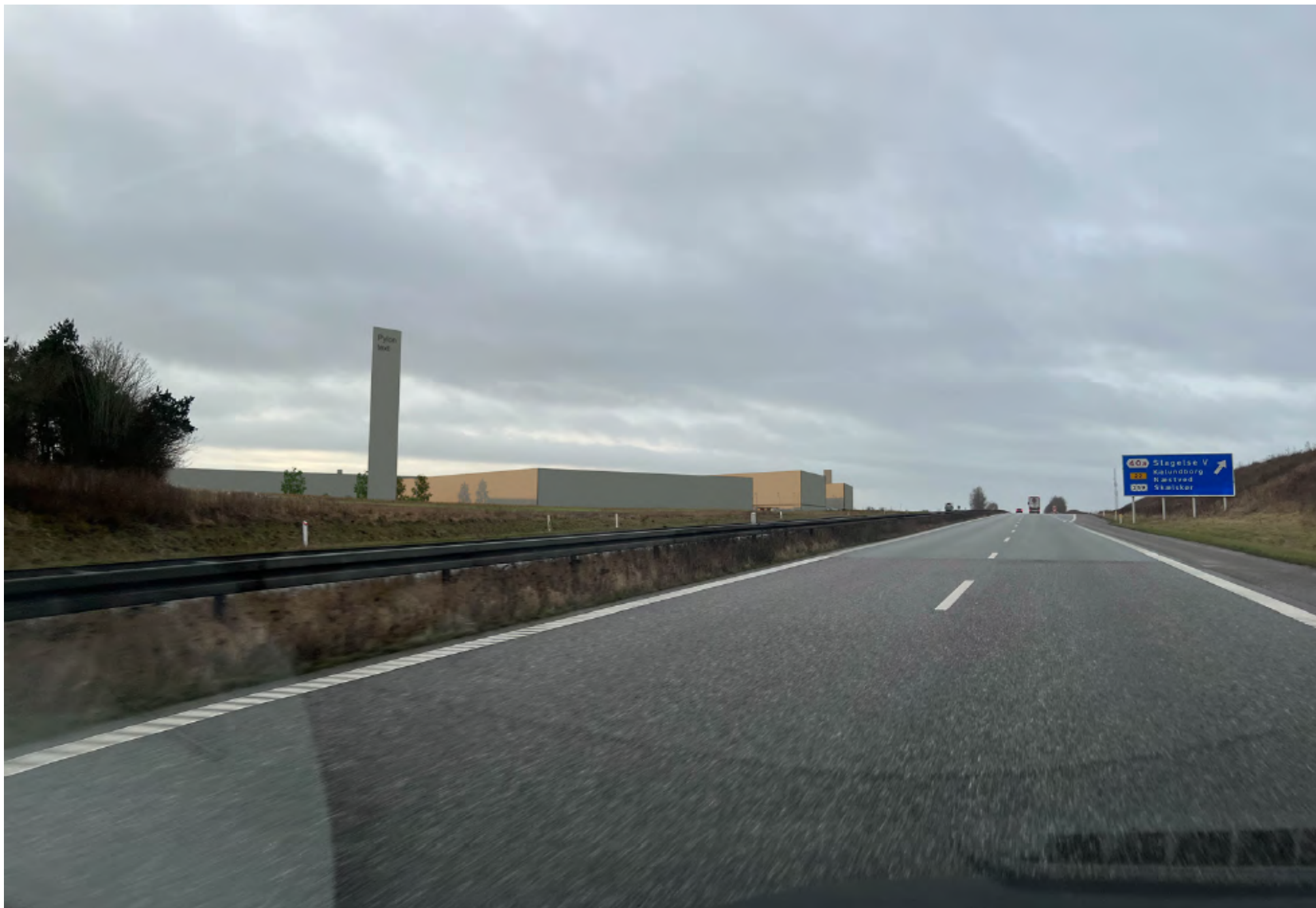
20 meter pylon på nordøstlig placering, fotostandpunkt c