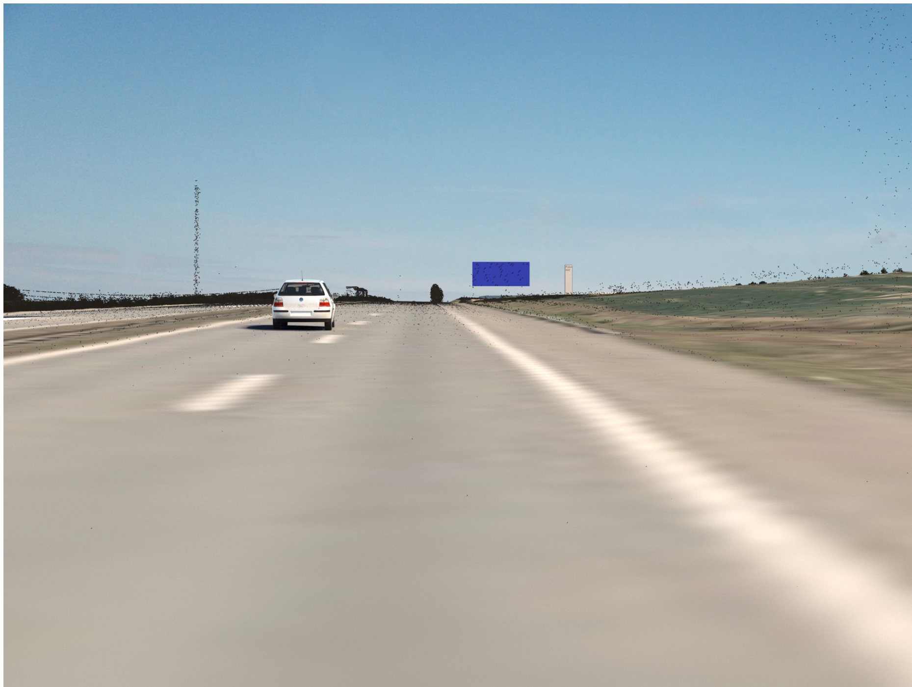
30 meter pylon på vestlig placering, fotostandpunkt a