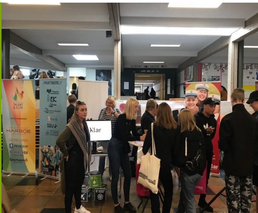
Grotten på Slagelse Gymnasium

På ZBC opstod den efterhånden kendte og populære "Håndværkervejen", hvor håndværkere i både uddannelses- og virksomhedsform af enhver slags samledes og promoverede sig for de besøgende. Mellem udstillerne var Forsvarets hovedværksteder, Malerfirmaet Holger Christensen og Søn A/S, ZBC Bygge & Anlæg, Teknik og Dataskolen, og Kokke & Tjener skolen.