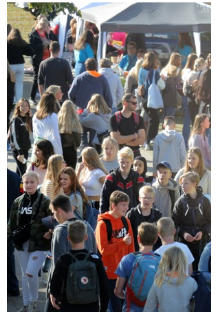
Alléen Orange zone