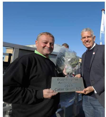
Borgmesteren uddelte EGU-Prisen til Cater Grønt A/S