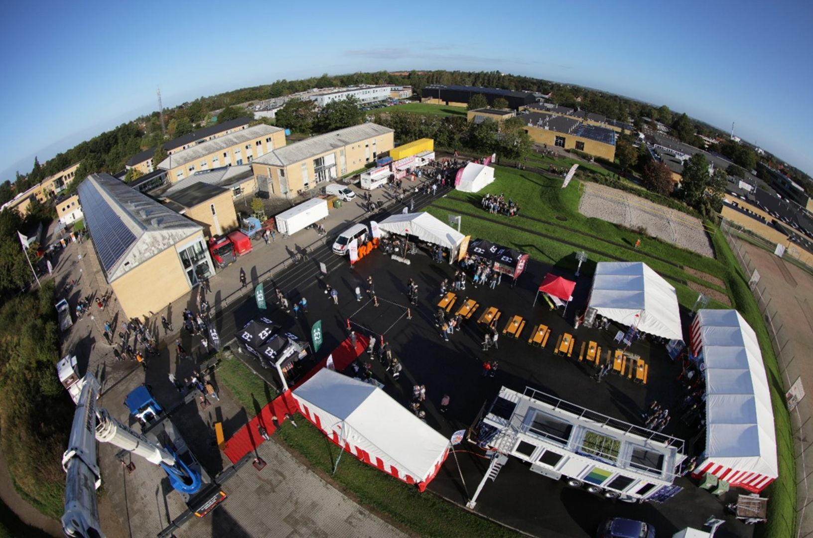
Pladsen før det hele gik løs, set fra Slagelse Liftudlejnings kæmpe lift