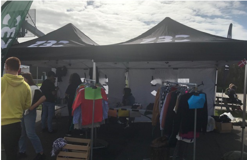
Tøjbyttecentral ZBC Business på Verdensmålstorvet