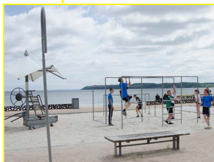
På stranden er der mulighed for at etablere nye faciliteter, som det f.eks. er gjort i Fredericia.

Helhedsplanen udarbejdes af Slagelse Kommune i samarbejde med relevante konsulenter.