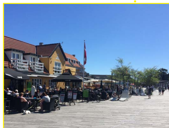
Cafélivet og handelslivet i Stillinge Strand kan styrkes ved at omlægge busholdepladsen til et torv med plads til ophold, leg, boder, udeservering o.lign., som det f.eks. er gjort i Marielyst.