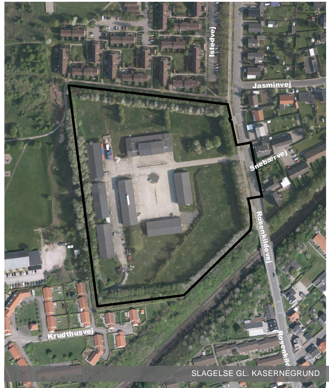
SLAGELSE GL. KASERNEGRUND

Planforslaget har været fremlagt i offentlig høring fra den 2. september 2016 til den 28. oktober 2016.