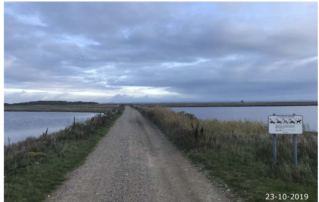
Egholm i nord er forbundet til Agersø med en lang dæmning. Egholm er ligesom Helleholm i syd privat ejendom.