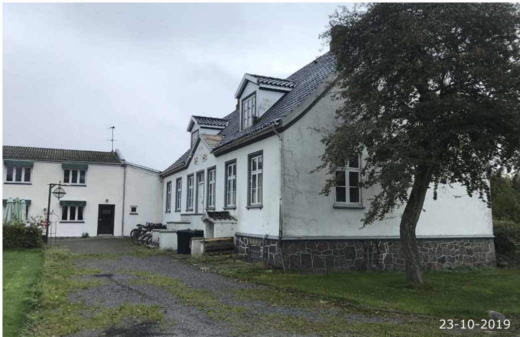
Agersøgård, Egholmvej 4. Oprindeligt anlagt som lystgård i ca. 1703 og siden i 1890 etableret som kro.