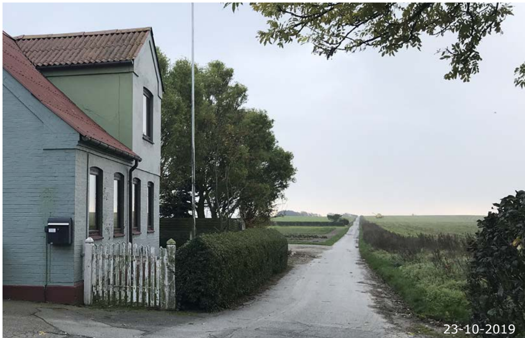
Lange kig ud i marklandskabet omkring Agersø by - her Agersøsundsvej.