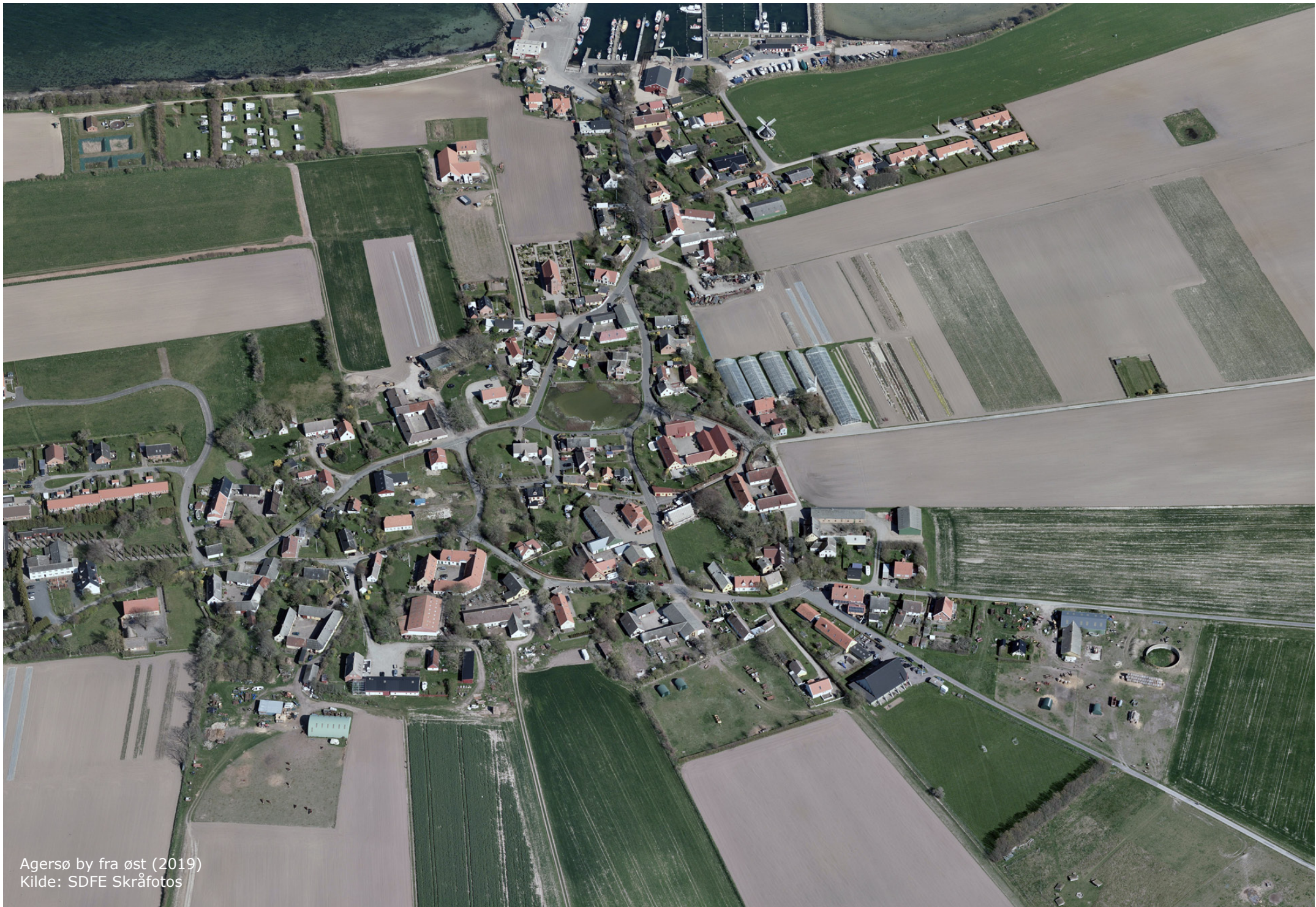
Agersø by fra øst (2019)