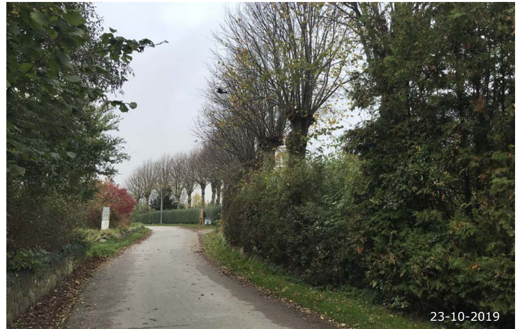
Egholmvej mod nord ud af Agersø by. Vejens let slyngede forløb understreges af rækken af vejtræer.