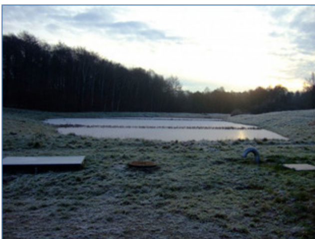
Figur 1 Et vådt regnvandsbassin i Silkeborg der er opdelt i tre sektioner

I kraft af sit store, permanente vandvolumen, vil et vådt regnvandsbassin udjævne stødbelastninger af forurenende stof fra oplandet. Bassinet får med tiden karakter af et semi-naturligt vandområde og kan opnå rekreativ værdi i nærmiljøet. I naturmæssig henseende kommer det til at fungere på linje med en naturlig vandhulsbiotop.