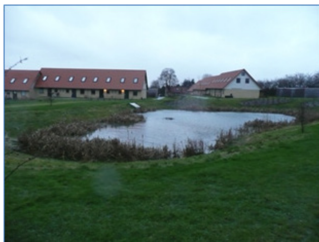
Figur 2 Et vådt regnvandsbassin i Århus udført uden sektionsoptdeling

Samtidigt med at et vådt regnvandsbassin renser det afstrømmede regnvand, kan det benyttes som forsinkelsesbassin. Dette kræver at volumen over normal vandstand bruges til forsinkelse (Figur 3). For rensningen om at gøre er der dog ikke behov for et forsinkelsesvolumen, idet rensningen primært foregår i den våde del af bassinet i tørvejrperioderne mellem regnhændelser. Oftest kombineres forsinkelse og rensning i samme bassin (Figur 3), men i princippet er der intet til hinder for, at holde de to funktioner fysisk adskilt.