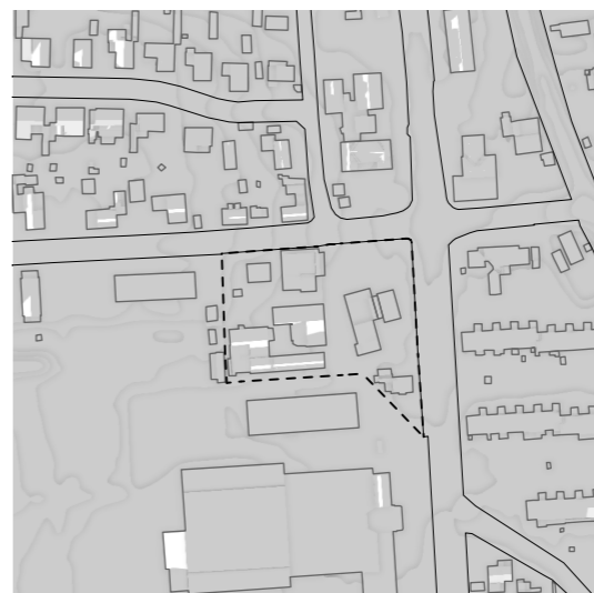
Vinter 22. December