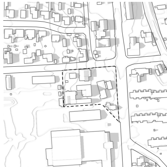
Sommer 21. Juni