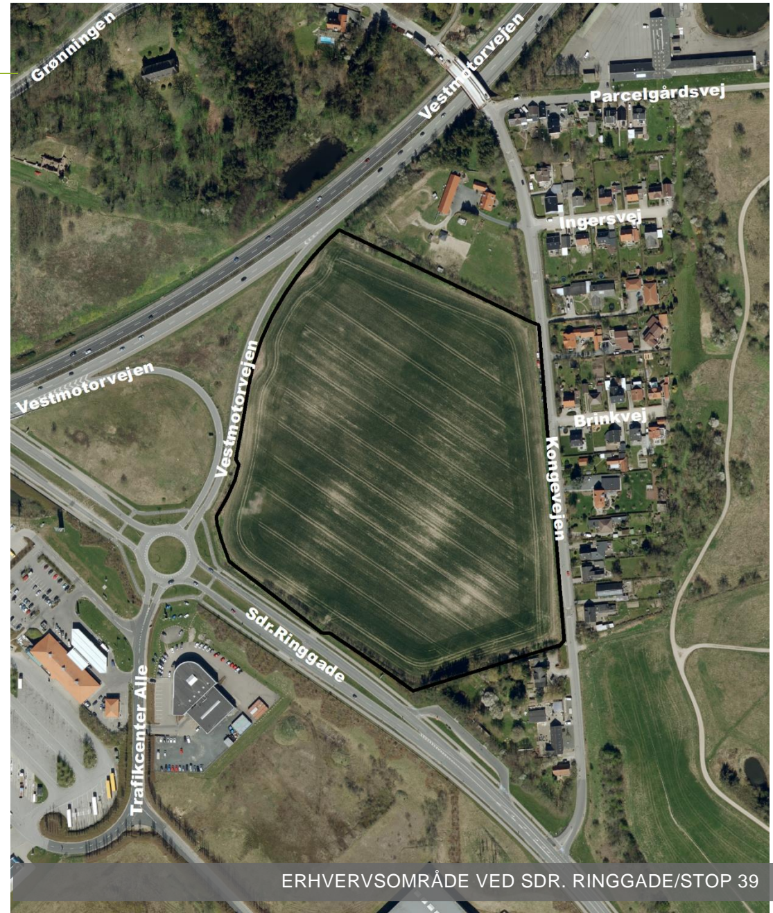
ERHVERVSOMRÅDE VED SDR. RINGGADE/STOP 39

I Lov om miljøvurdering af planer og programmer og af konkrete projekter ( Lovbekendtgørelse nr. 448 af 10. maj 2017 ) er der i Bilag 3 fastlagt kriterier, der skal anvendes ved vurderingen af, om en plan eller program kan få betydning for indvirkning på miljøet. Som en del af vurderingen, høres berørte myndigheder. Proceduren er yderligere uddybet i vejledningen til loven ( Vejledning nr. 9664 af 18. juni 2006 – Vejledning om miljøvurdering af planer og programmer ).