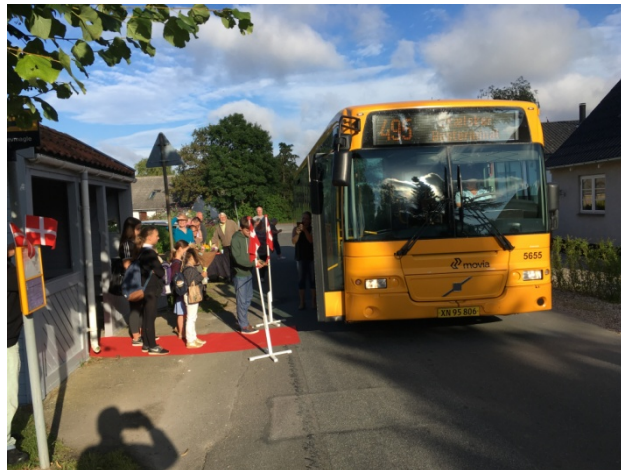
Foto af fejring af bla. ny busrute til Flakkebjerg, Dalmose Slagelse.

TAK FOR DU/I TOG TID TIL AT BESVARE SPØRGSMÅLENE.